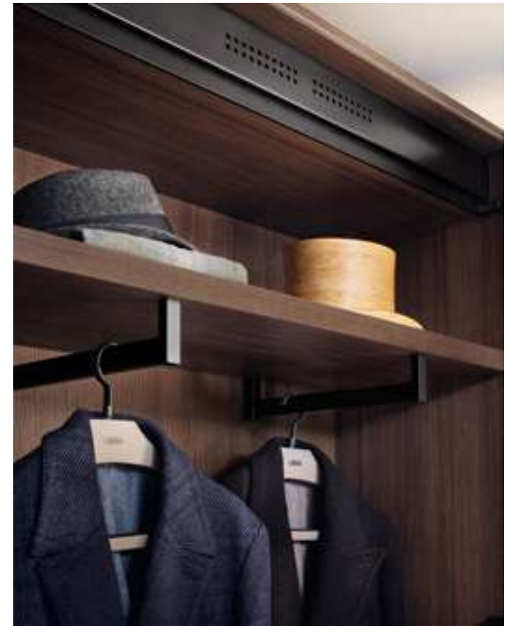
Armadio, Wardrobe Prima