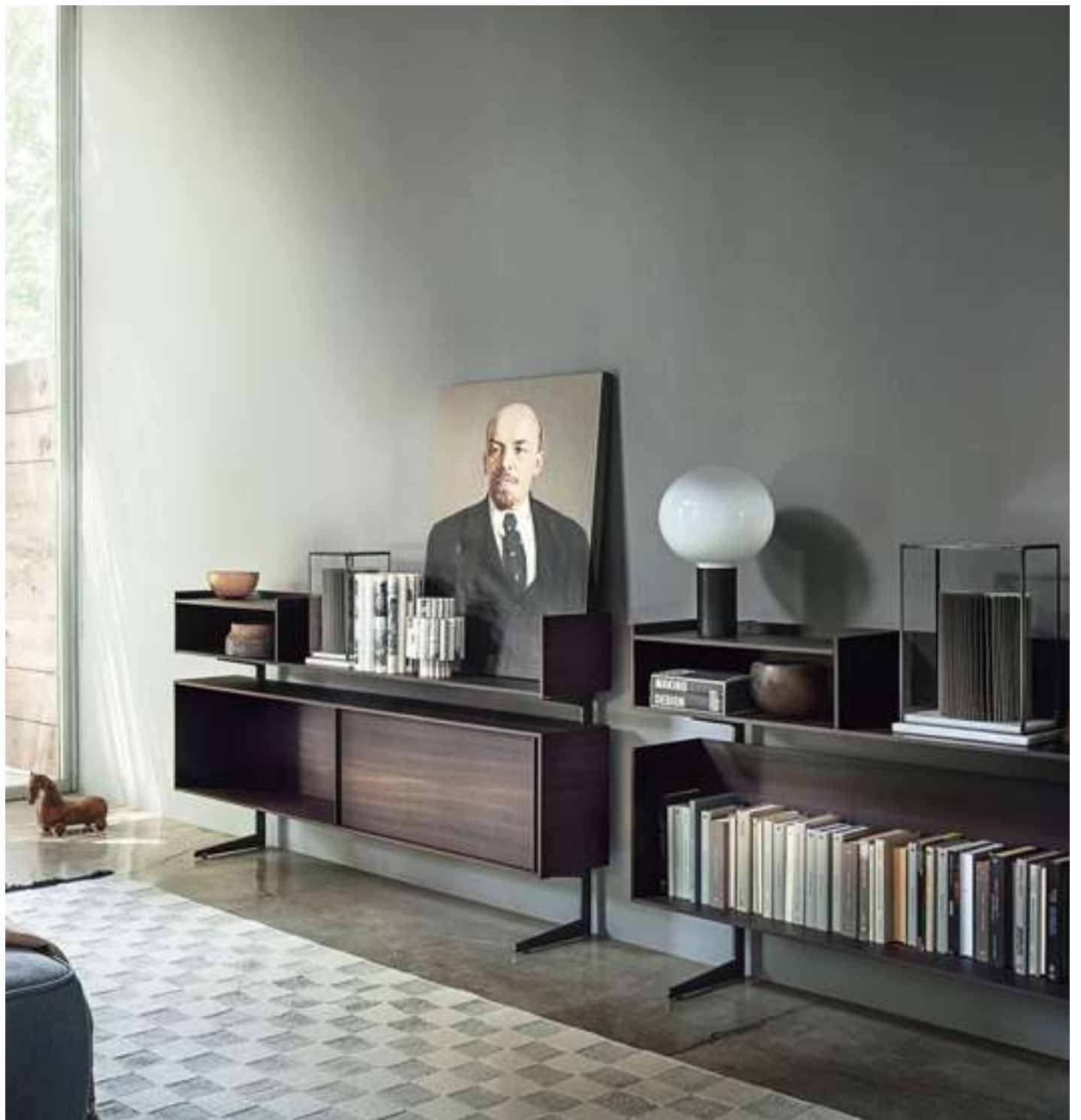
Contenitore a Giorno, Day Container Court Yard