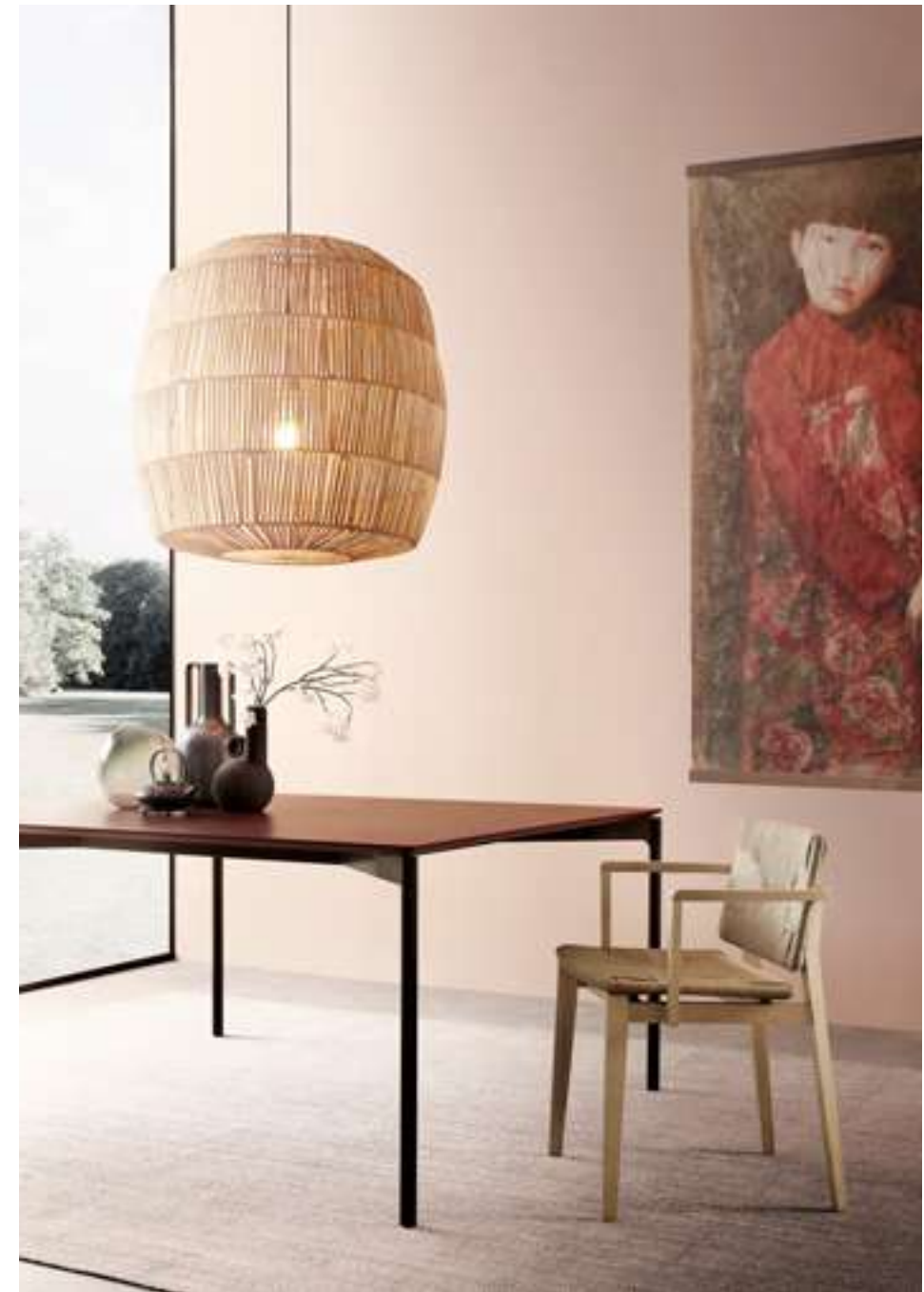
Sedia, Chair Hati Tavolo, Table Luce