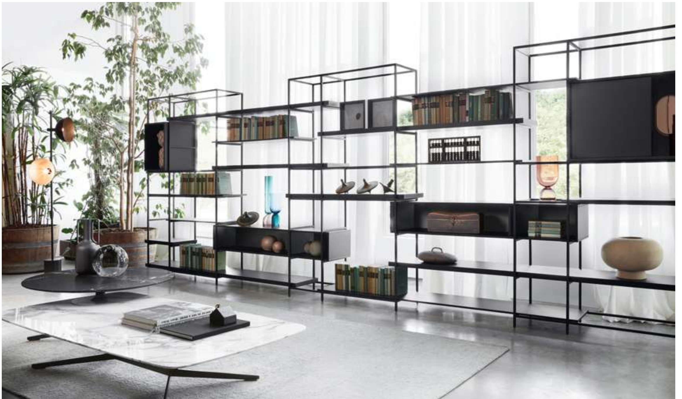
Libreria, Bookcase Plain Tavolino, Coffee Table Oydo