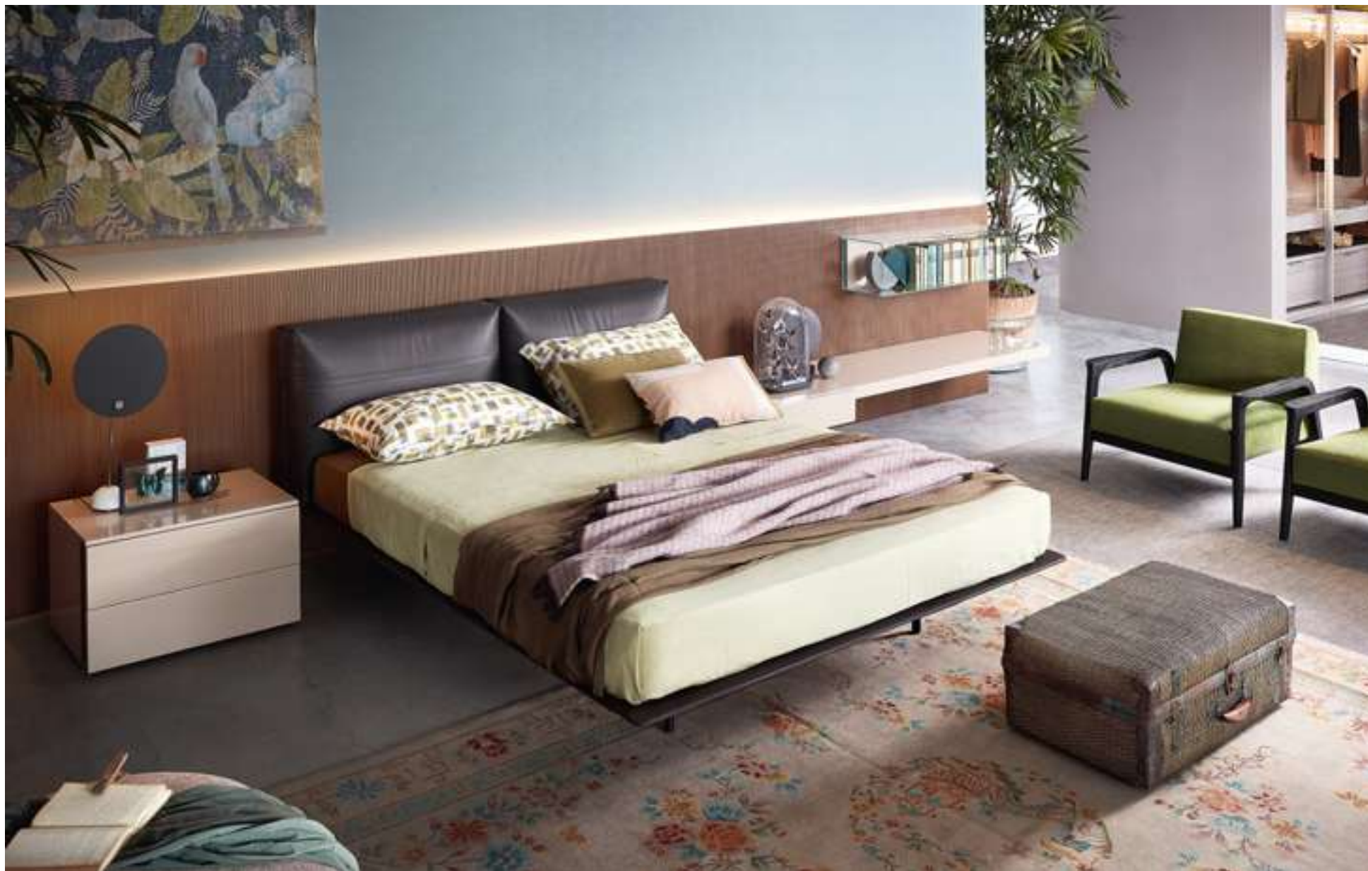
Letto, Bed Mynight Storage System LT40