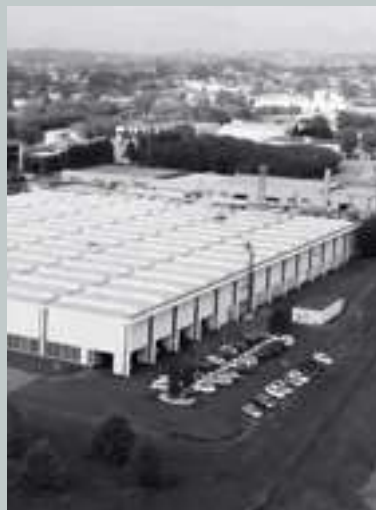
The Giussano facility designed by Angelo Mangiarotti