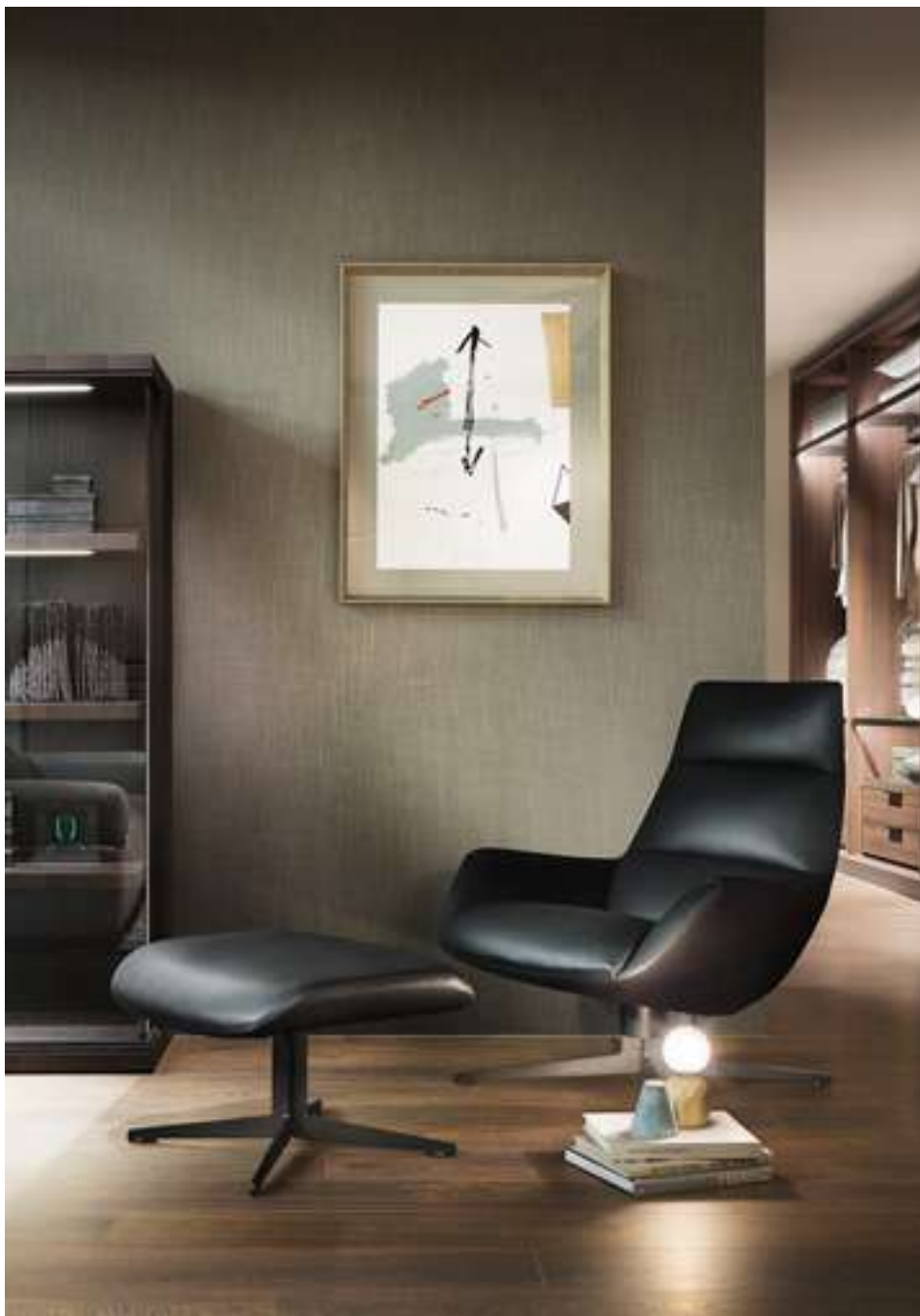
Bergère and Pouf Lady Jane