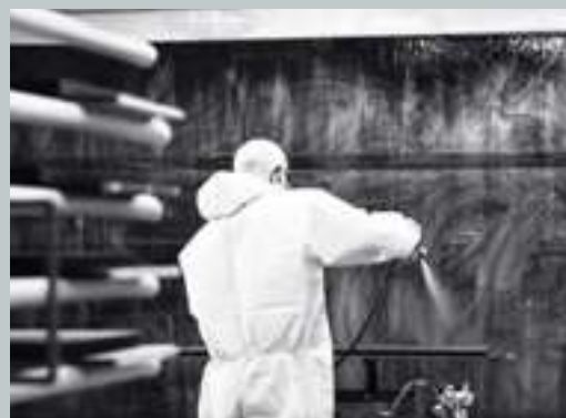
Lema – Made in Italy – Innovation – Tradition – Quality – Personalization – Industry – Craftsmanship.