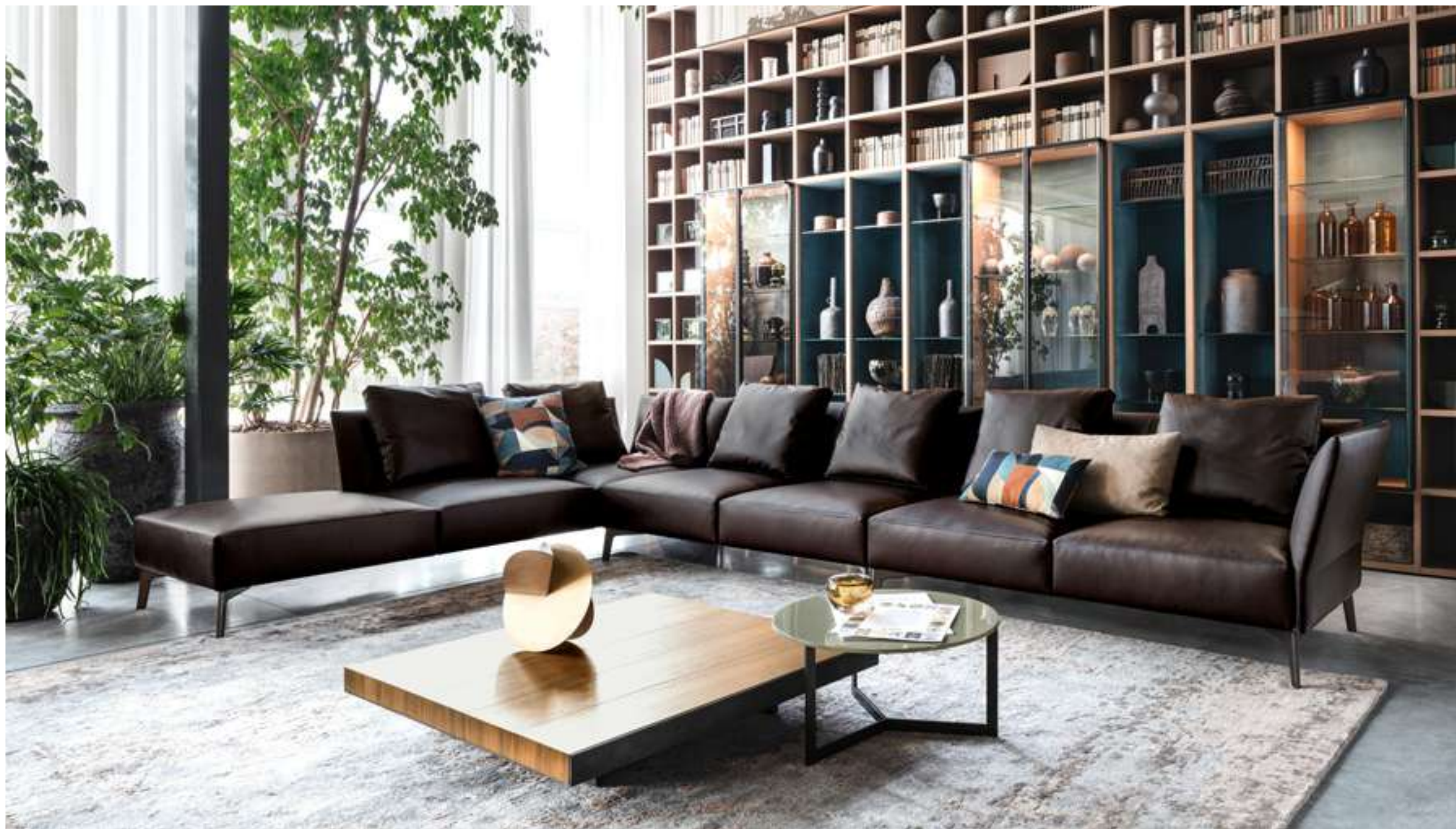
Divano, Sofa Jermyn Modular System Selecta