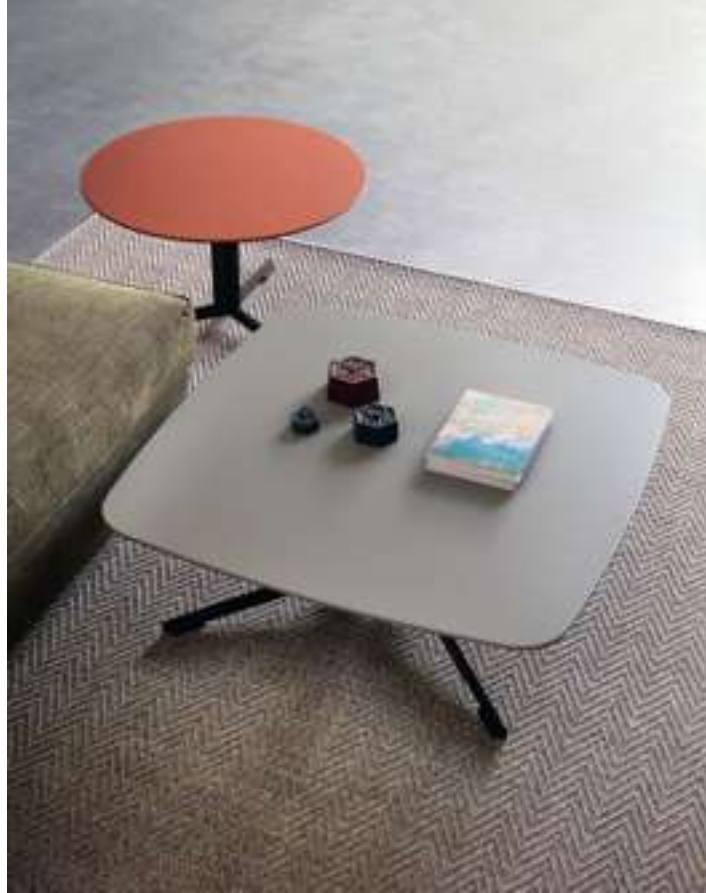
Tavolino, Coffee Table Oydo Novità, News 2021