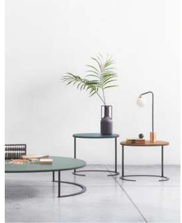
Tavolino, Coffee Table Ortis