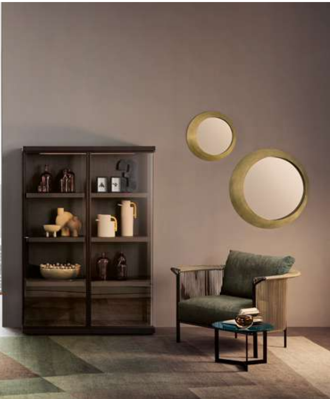
Tavolo, Table Shade Poltroncina, Armchair Bea Poltrona, Armchair Alton