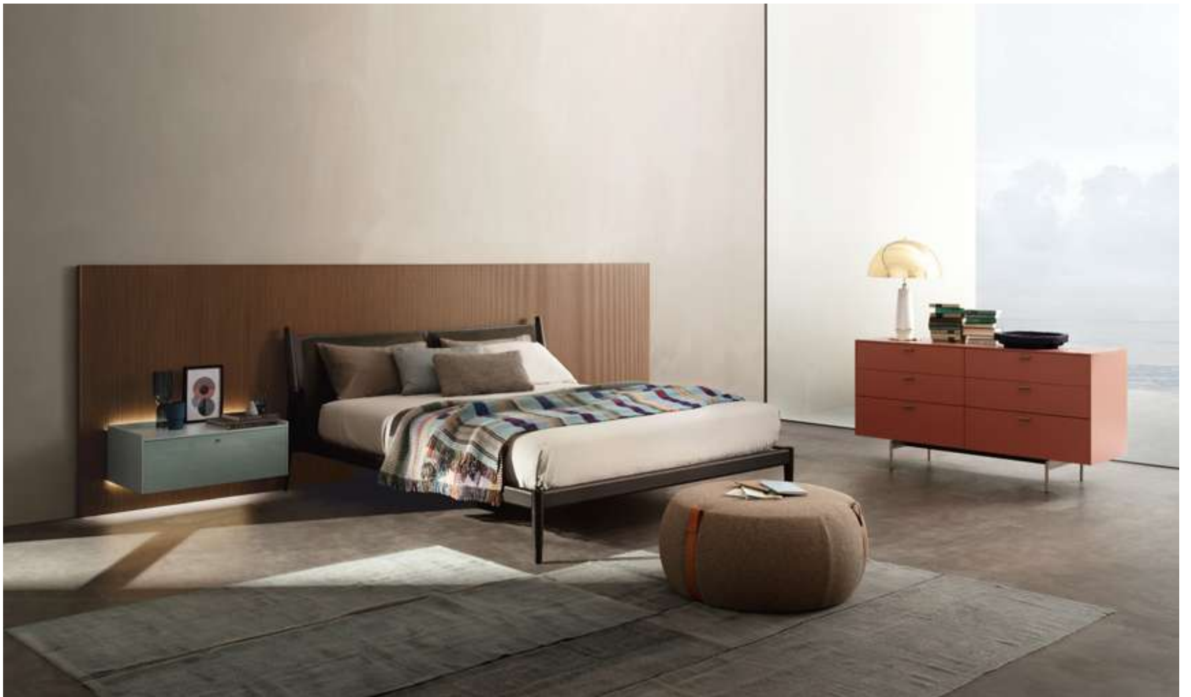
Letto, Bed Maddox Storage System LT40