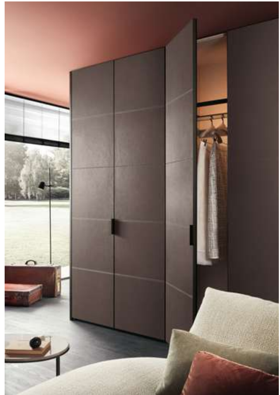
Armadio, Wardrobe Nur