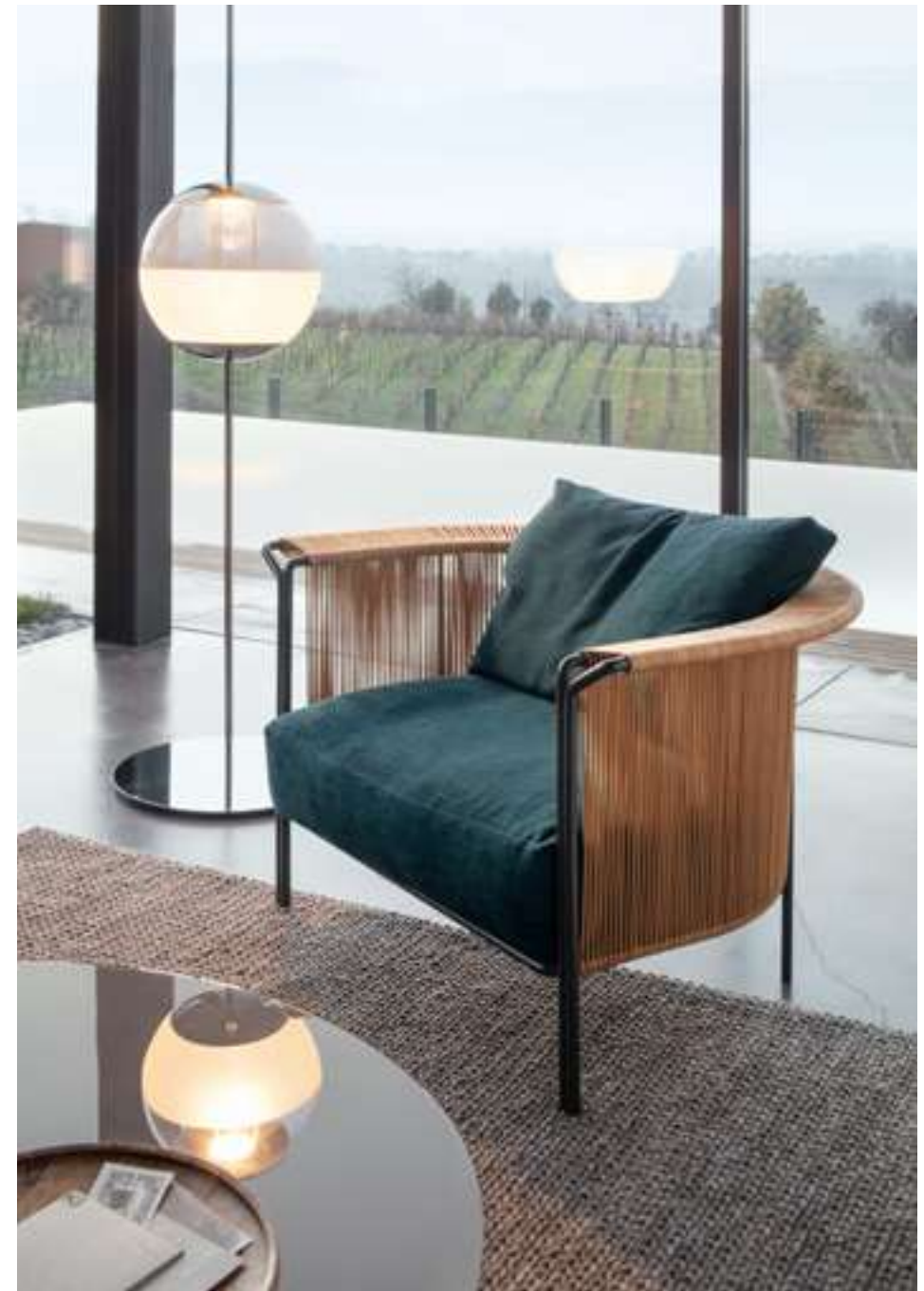
Poltrona, Armchair Alton