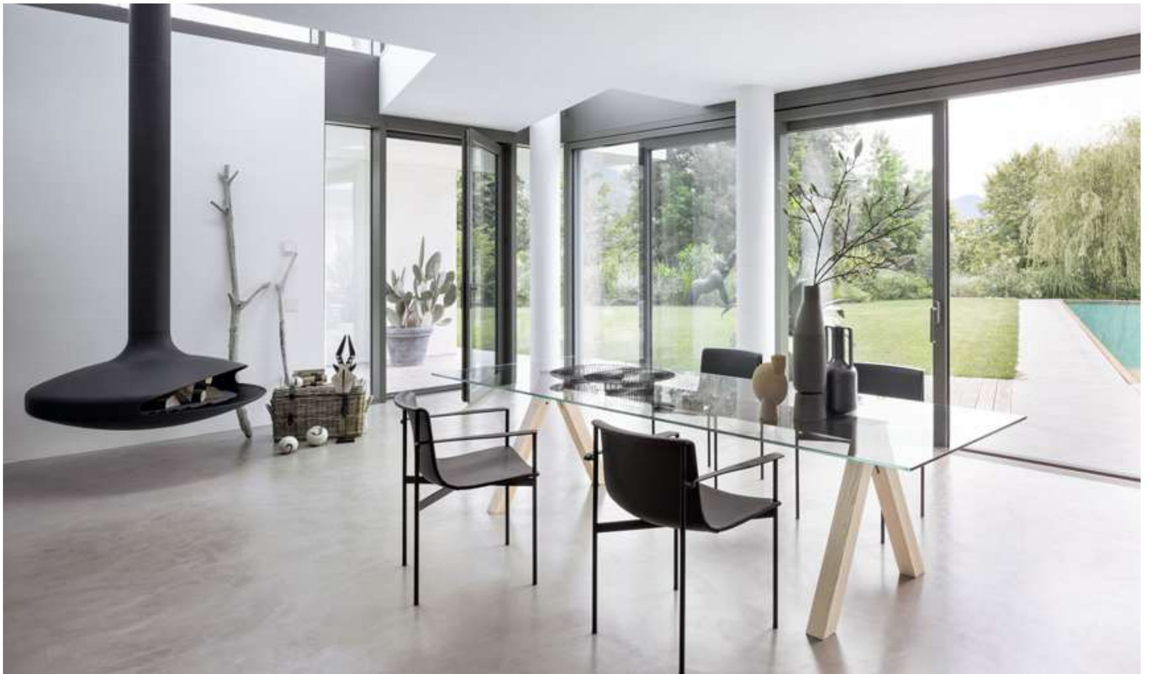
Tavolo, Table Sesto Sedia, Chair Ombra