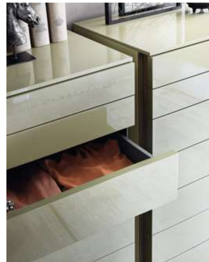
Settimanale, High Dresser Florens Novità, News 2021