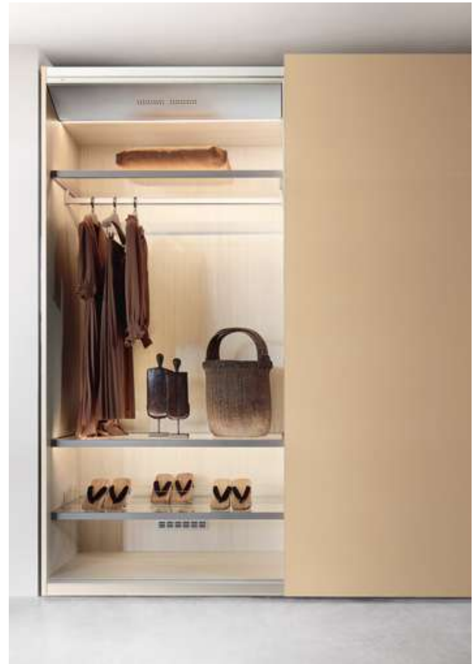
Armadio, Wardrobe Text