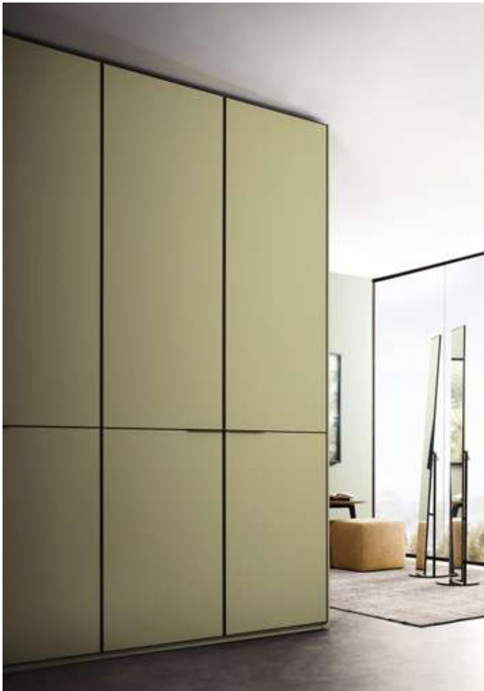
Armadio, Wardrobe Kyn Specchio, Mirror Mir