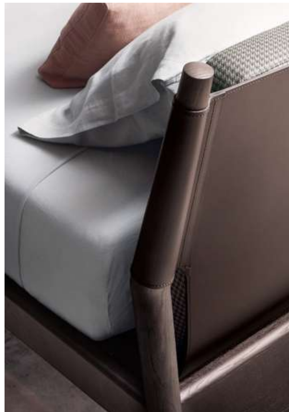
Letto, Bed Maddox