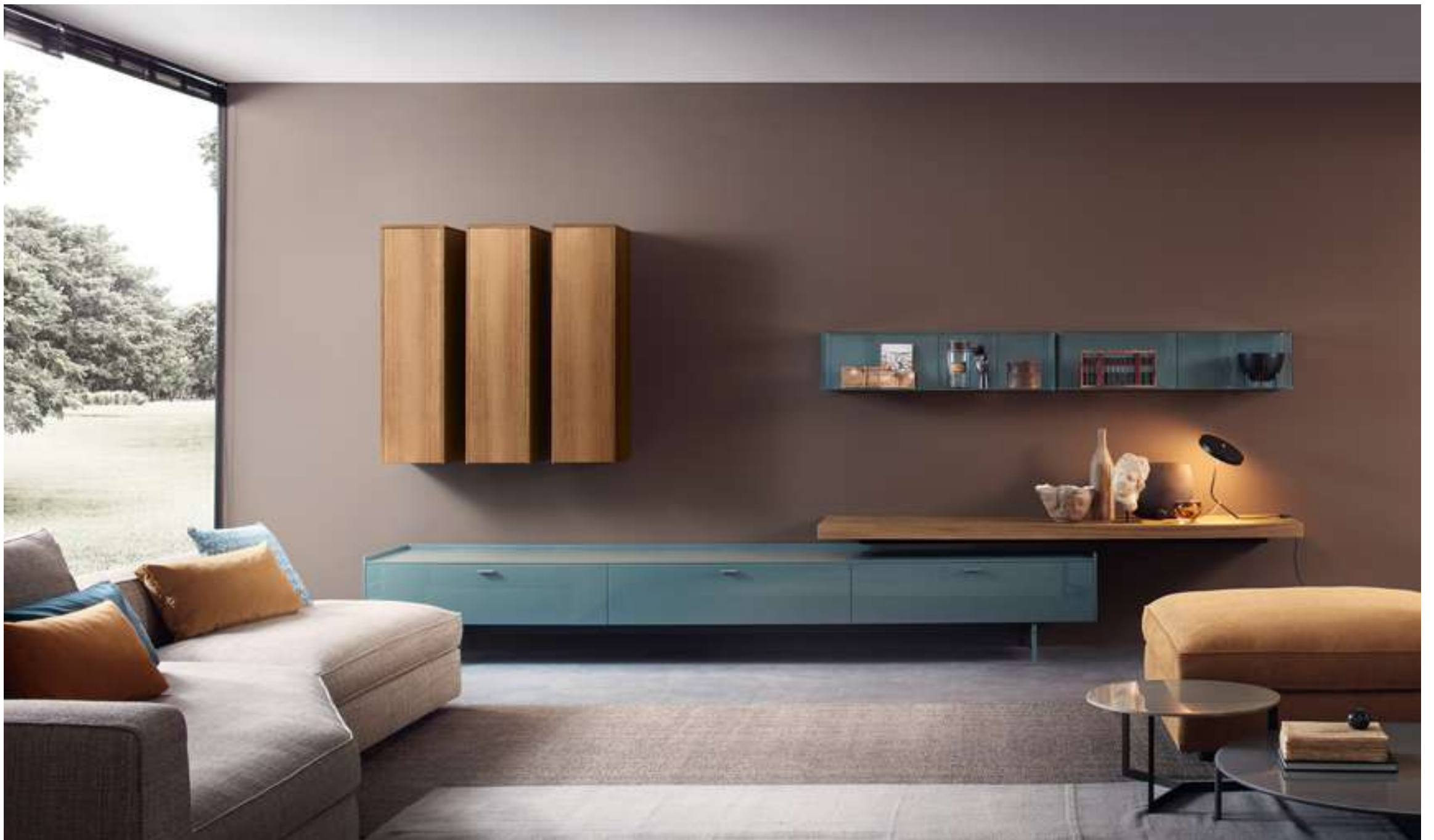
Storage System LT40 Divano, Sofa Snap