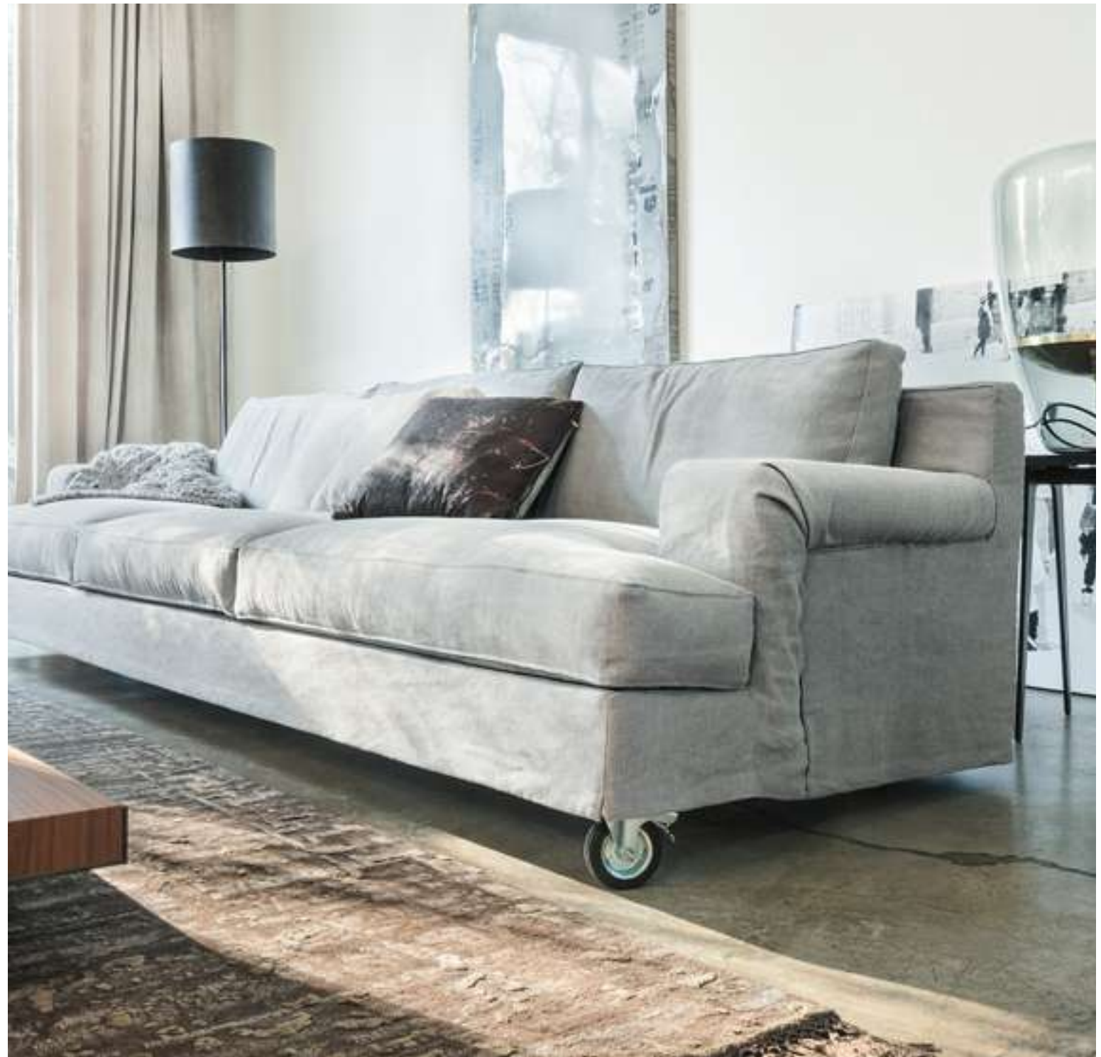
Divano, Sofa Aberdeen