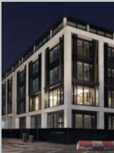
Bulgari Knightsbridge Palace Hotel in London