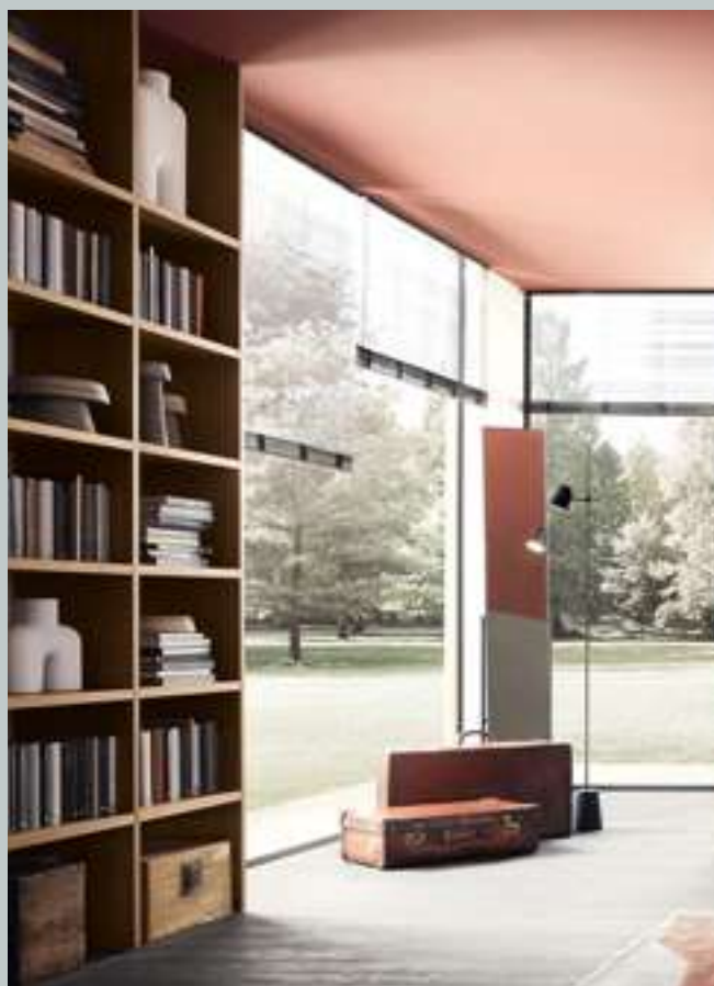
Specchio, Mirror Mir