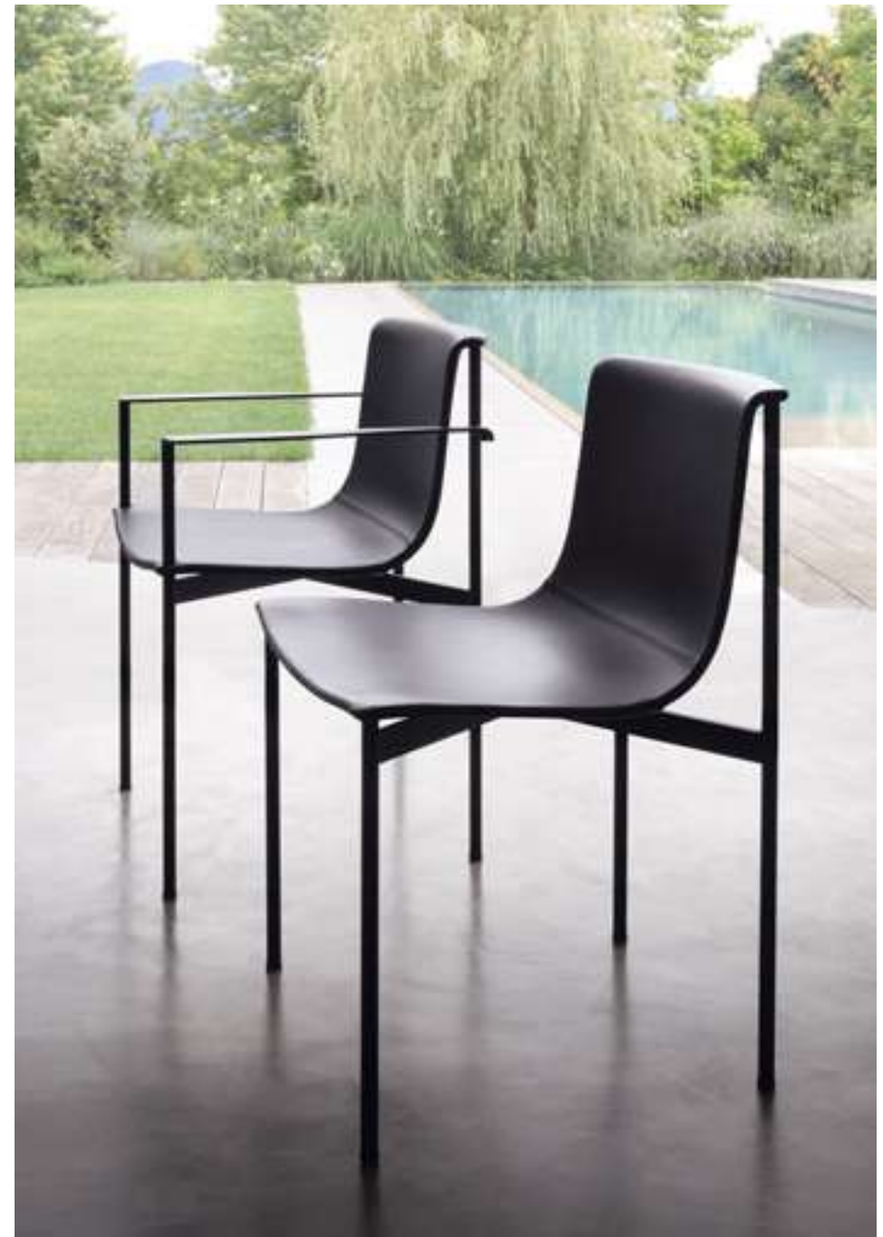
Sedia, Chair Ombra