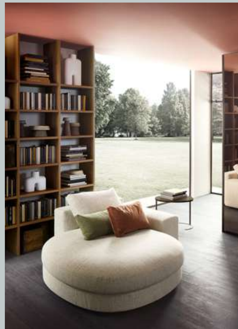
Divano, Sofa Venice Modular System Selecta