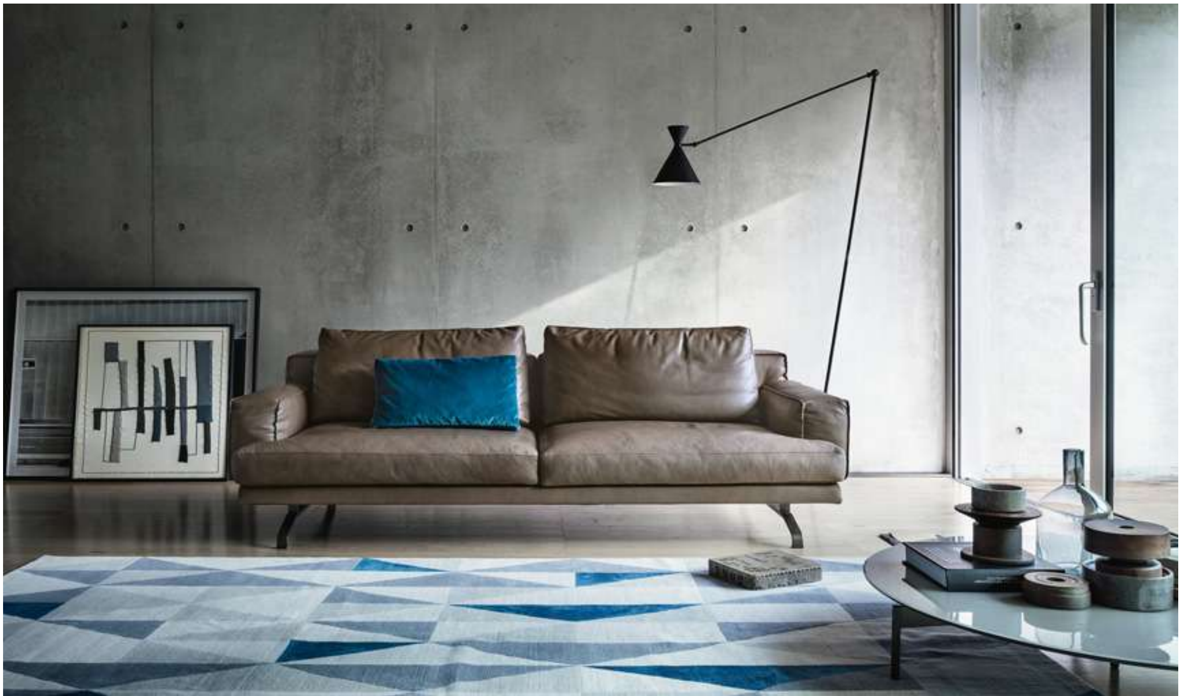
Divano, Sofa Mustique Tavolino, Coffee Table Cruise