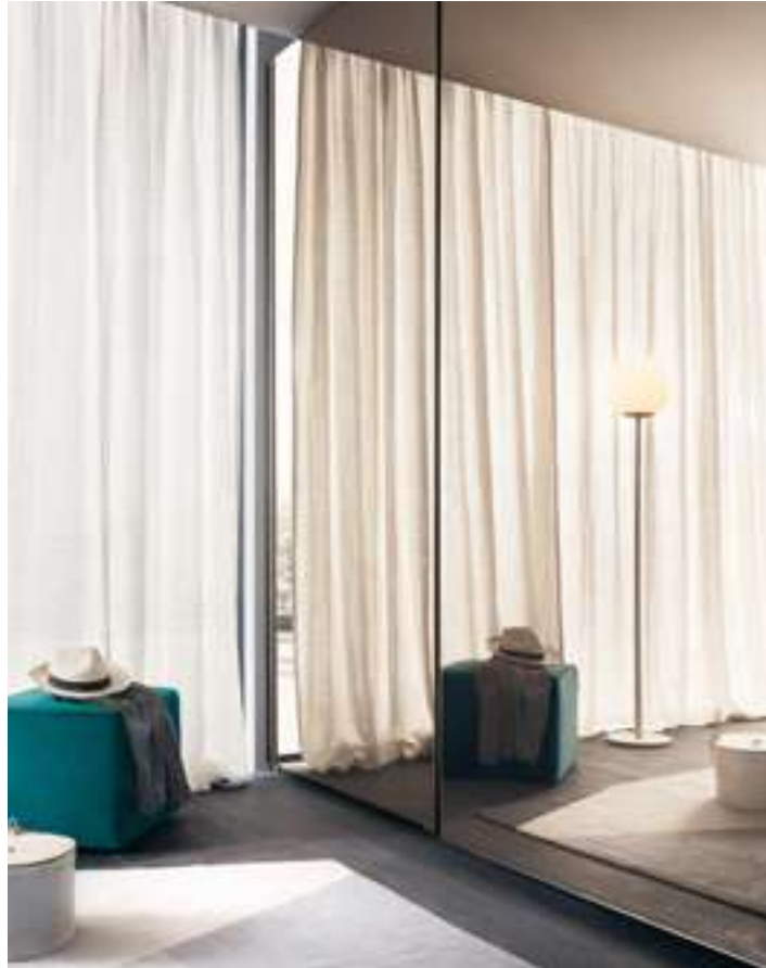
Armadio, Wardrobe Emery