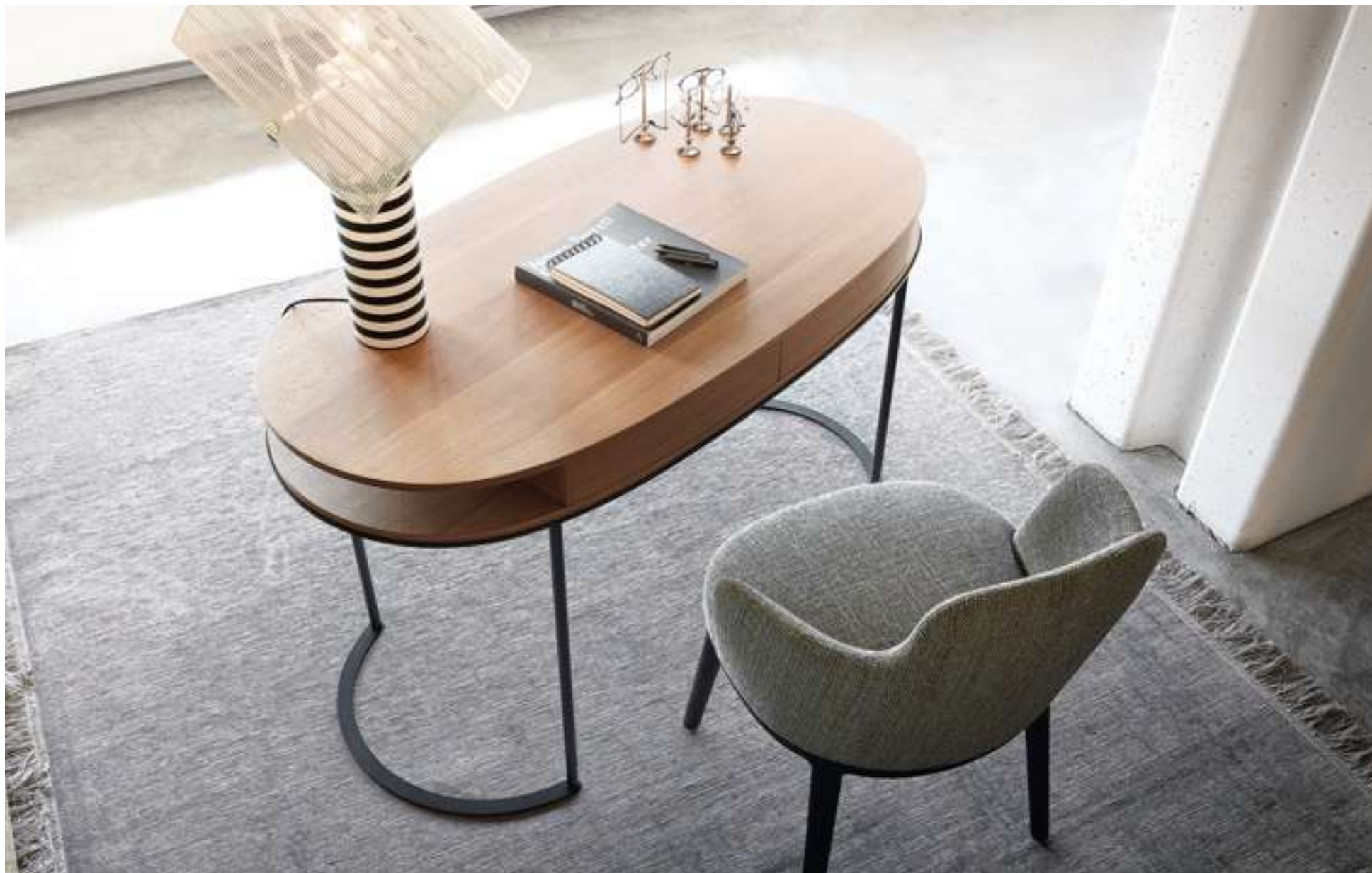
Scrittoio, Desk Ortis Novità, News 2021 Poltroncina, Armchair Lucylle