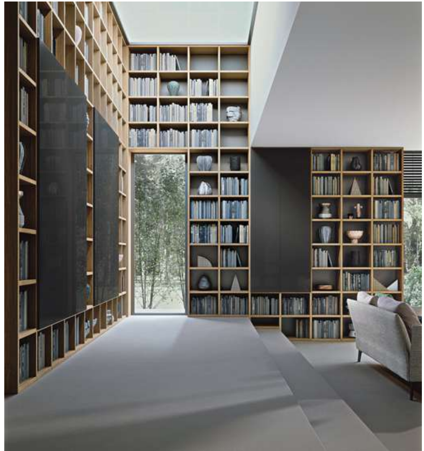
Modular System Selecta