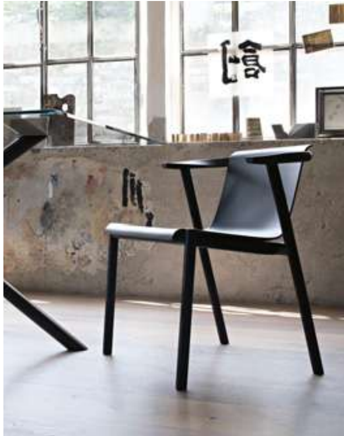
Sedia, Chair Bai Lu