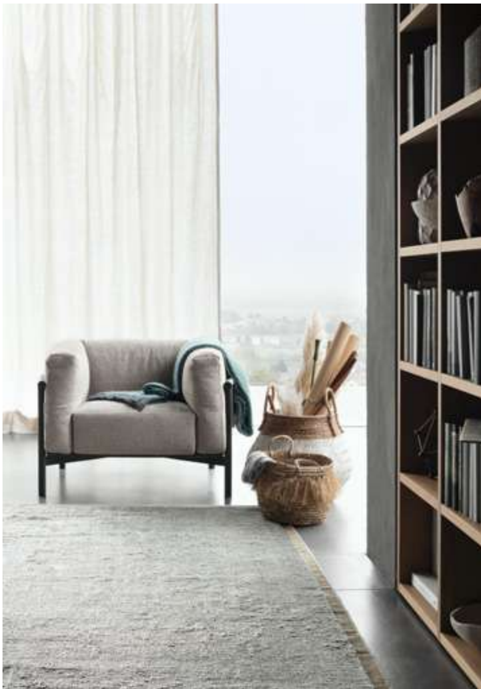
Poltrona, Armchair Talki Modular System Selecta