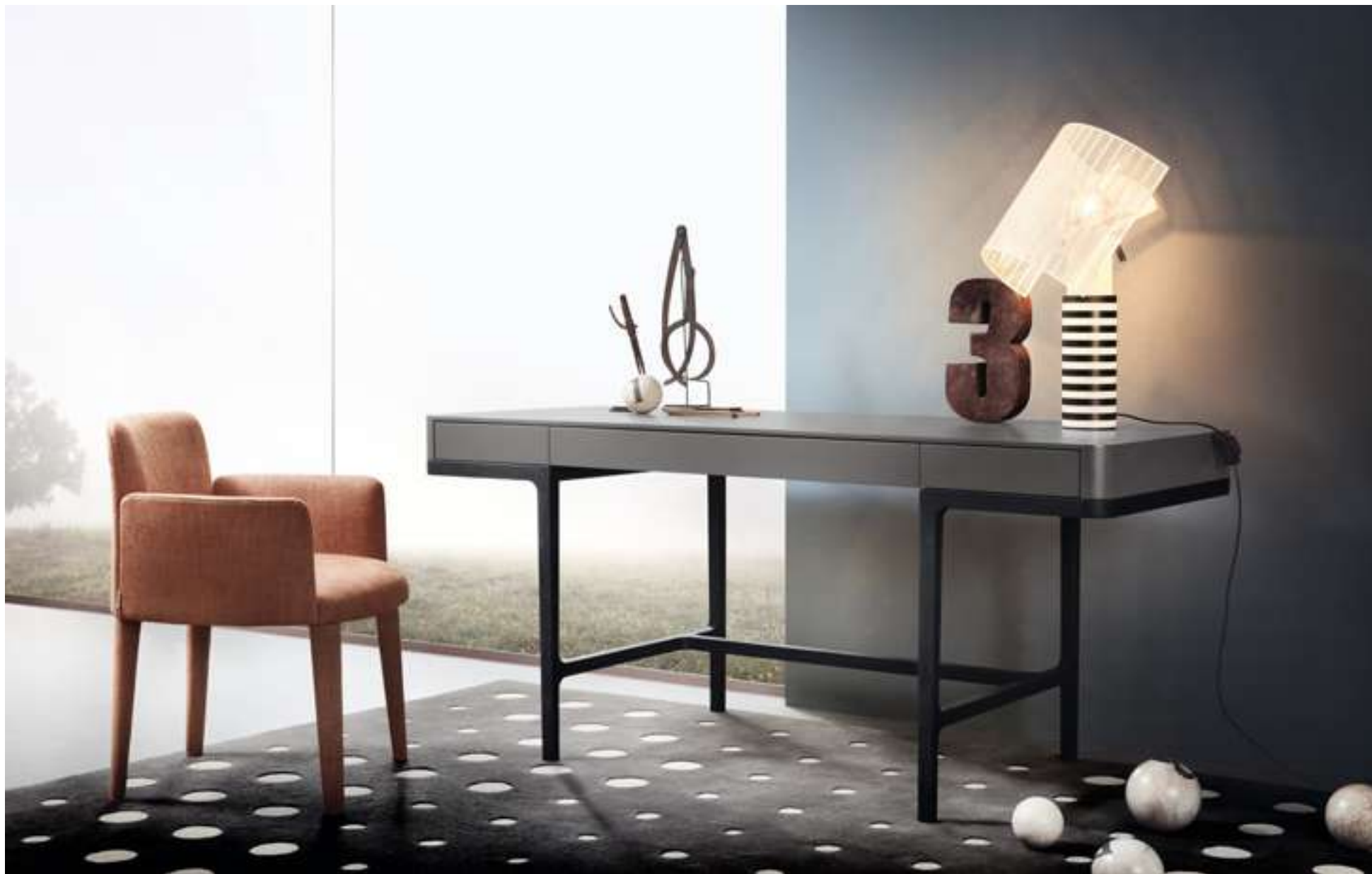
Scrittoio, Desk Victor Poltroncina, Armchair Babi