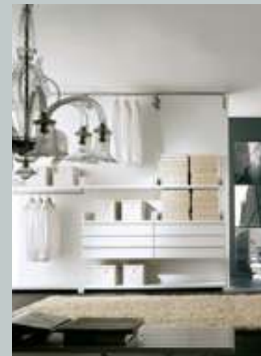
Lema unveils its first walk-in wardrobe