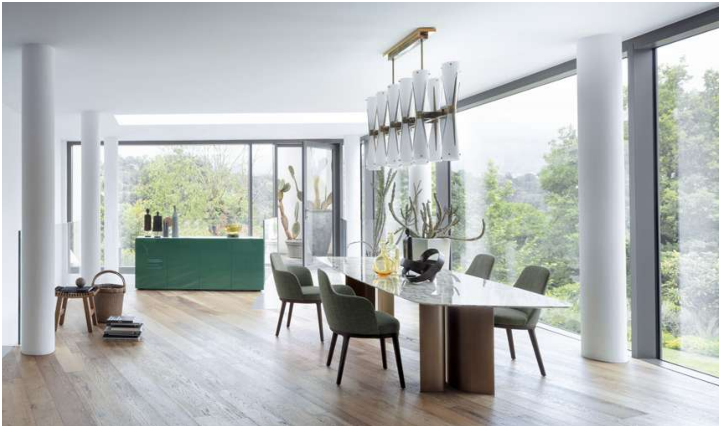
Tavolo, Table Gullwing Madia, Sideboard Florens Poltroncina, Armchair Lucylle