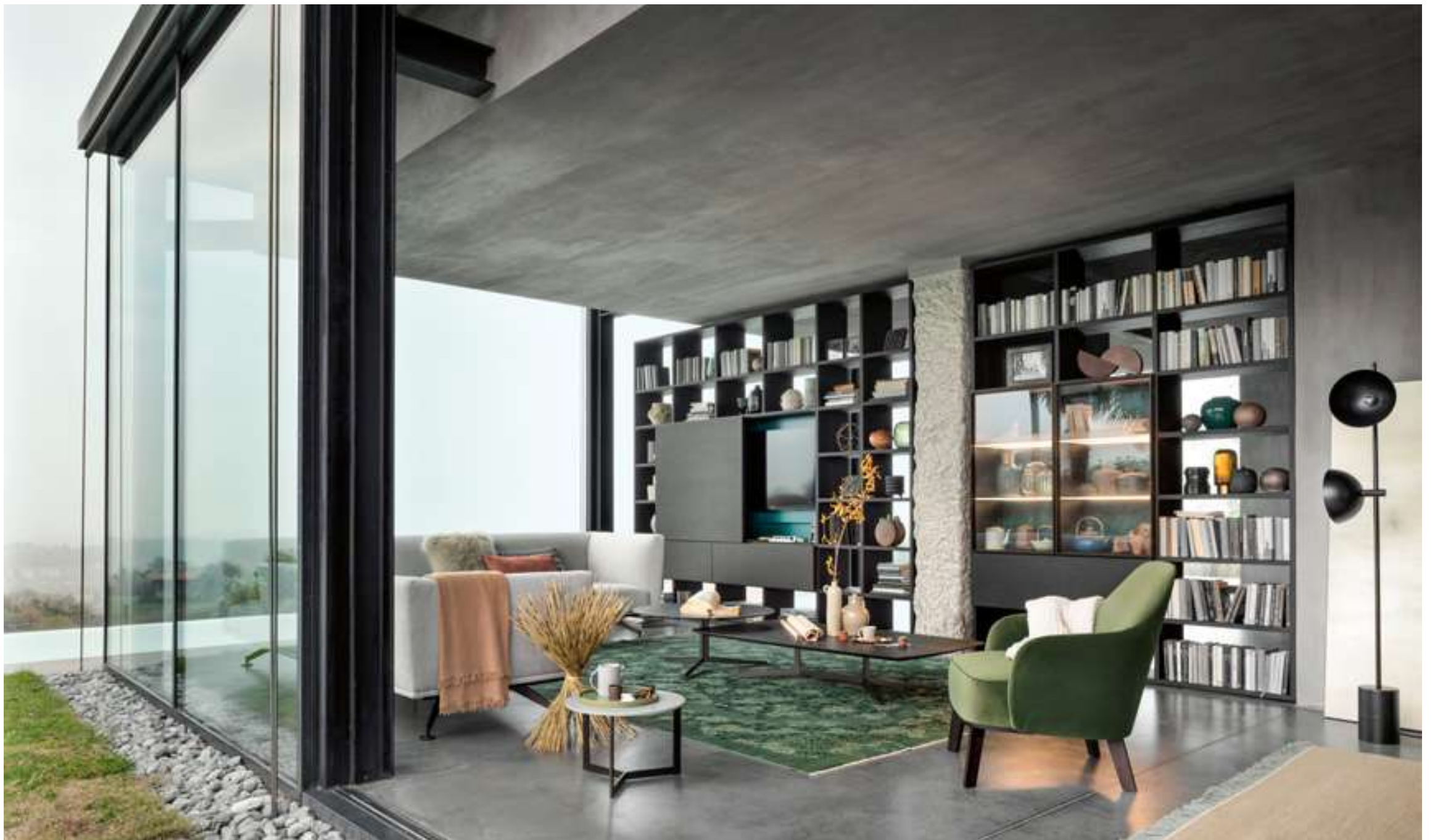
Modular System Selecta Divano, Sofa Neil Tavolino, Coffee Table Sign