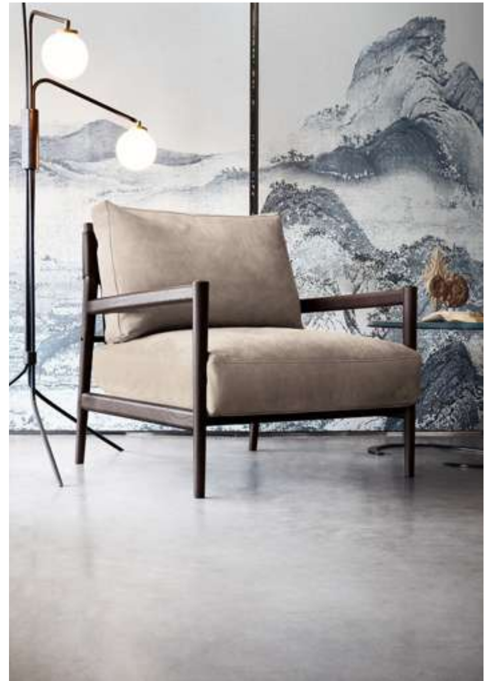
Poltrona, Armchair Maddix