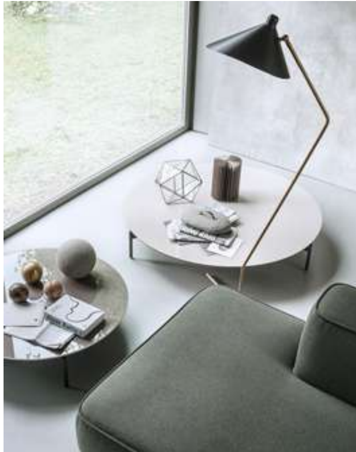
Tavolino, Coffee Table Cruise Divano, Sofa Cloud