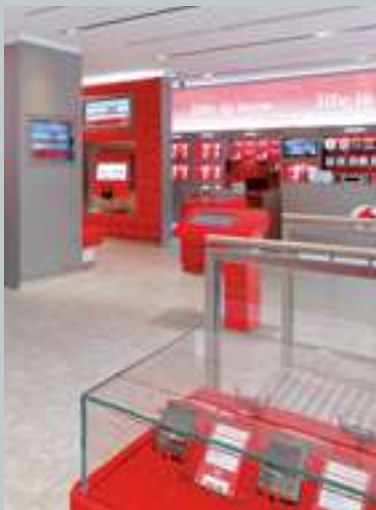
Vodafone stores - nearly 1000 in Italy