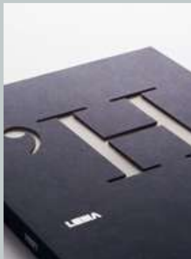
New website & catalogues