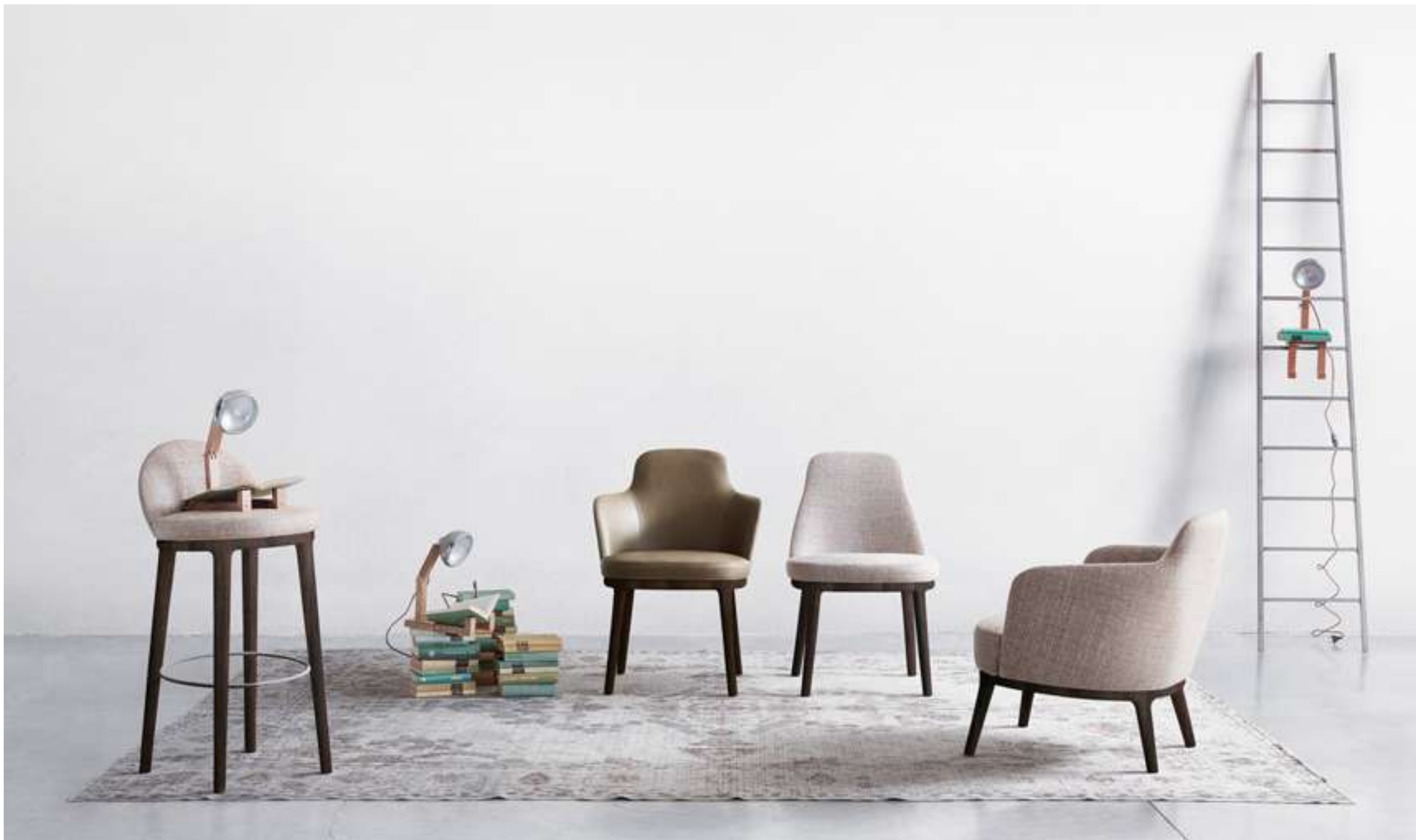
Sgabello, Stool Lucylle Poltroncina, Sedia Lucylle Chair, Armchair Lucylle