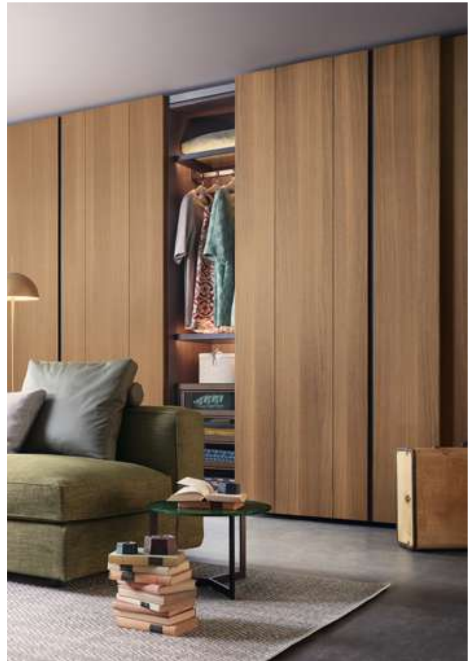
Armadio, Wardrobe Naica Tavolino, Coffee Table Sign