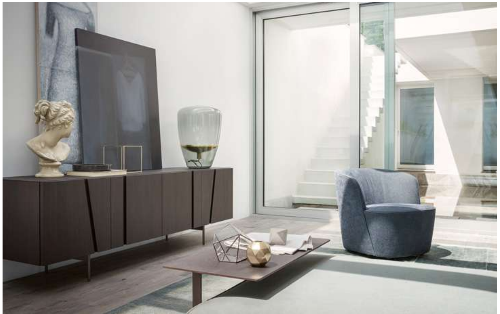
Madia, Sideboard Picture Poltrona, Armchair Felix