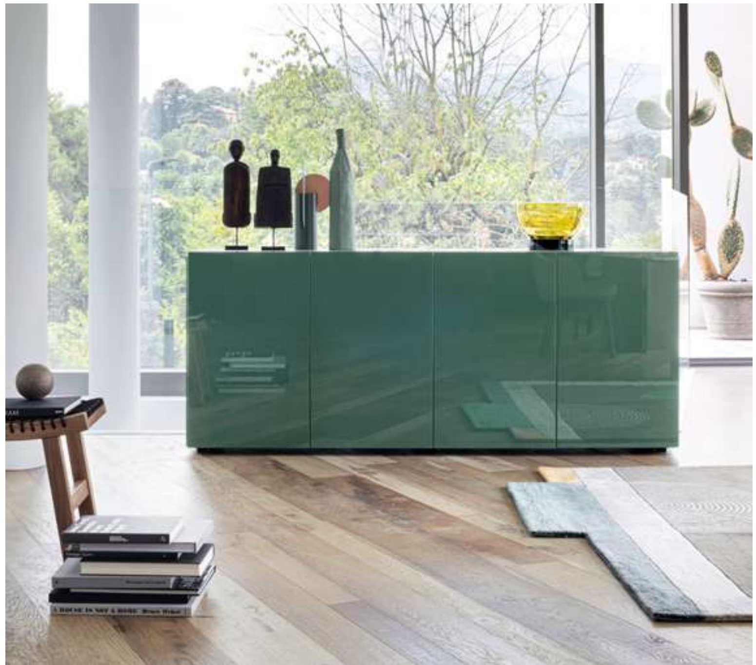
Madia, Sideboard Florence