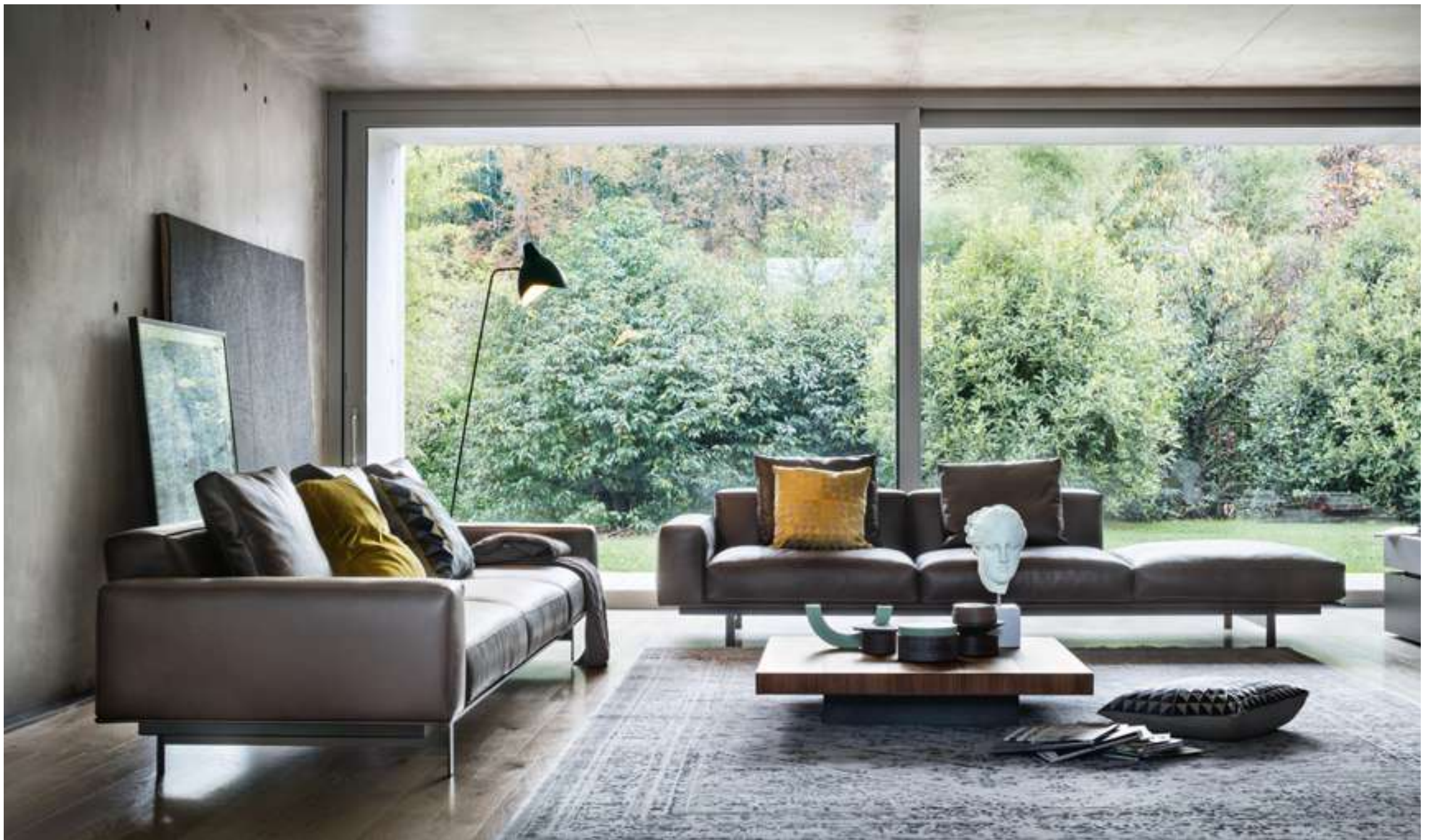
Divano, Sofa Yard