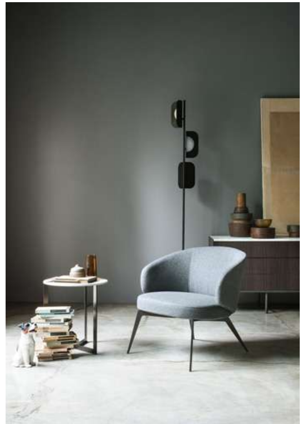
Poltrona, Armchair Bice Tavolino, Coffee Table Sign