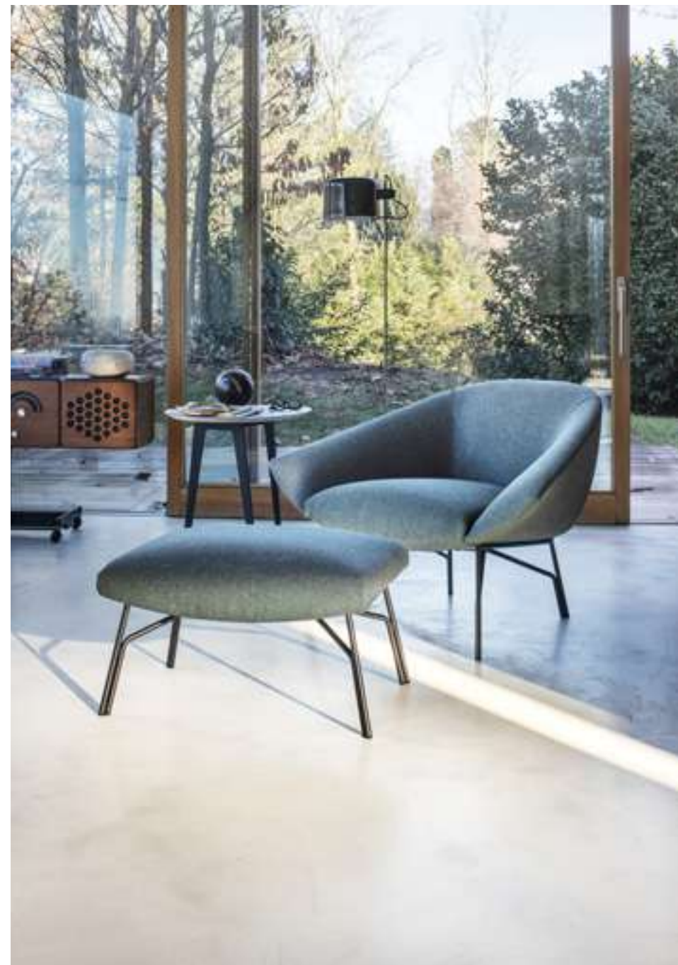
Poltrona, Armchair and Pouf Lennox