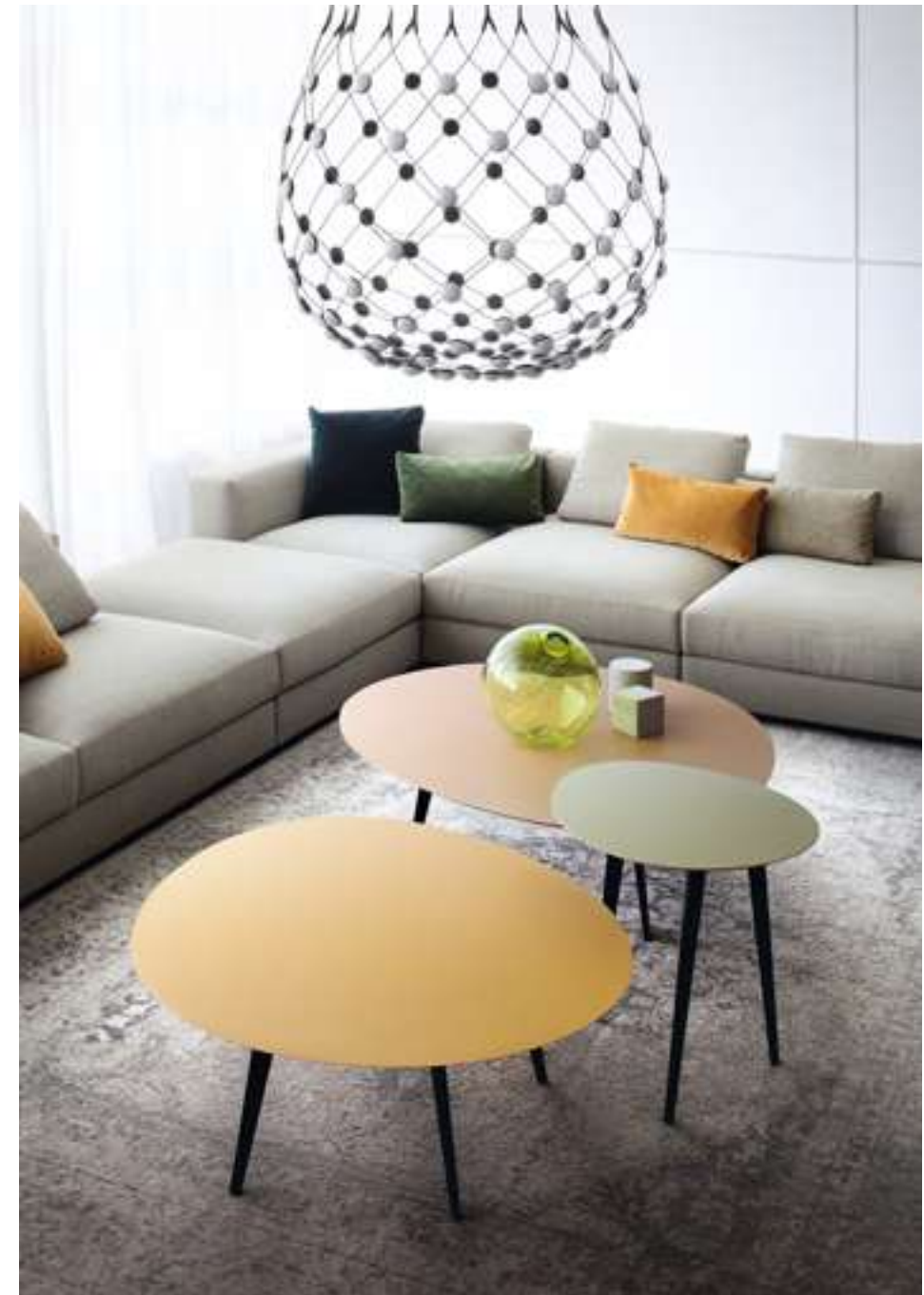
Tavolino, Coffee Table Flowers Divano, Sofa Venice