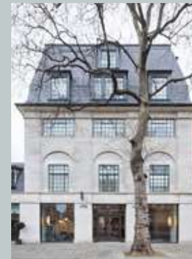
Lema at No.183 Kings Road