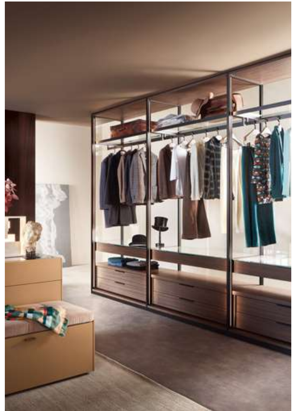
Armadio, Wardrobe Open