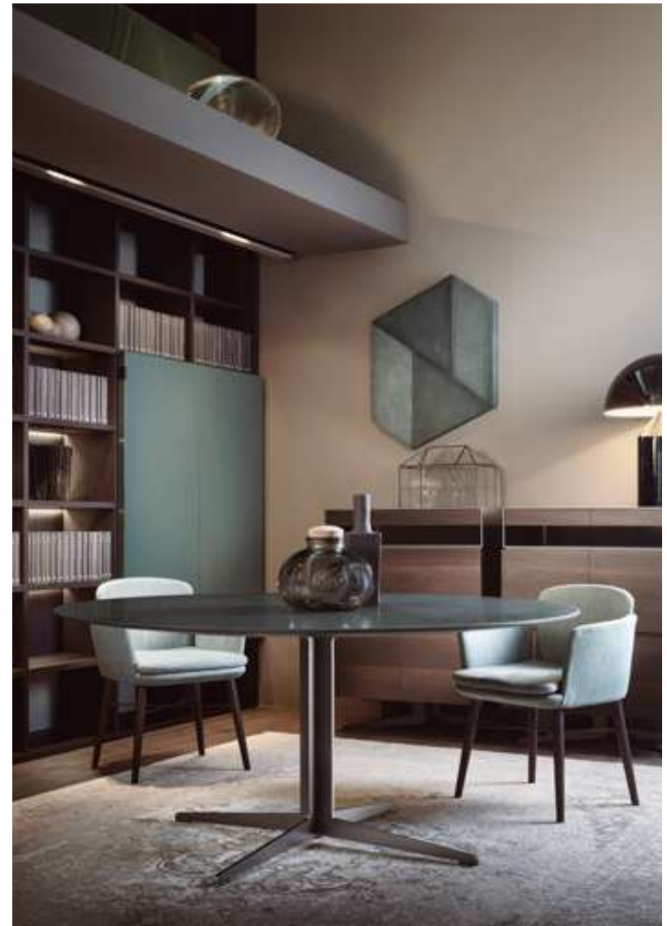
Tavolo, Table Graceland Poltroncina, Armchair Tabby