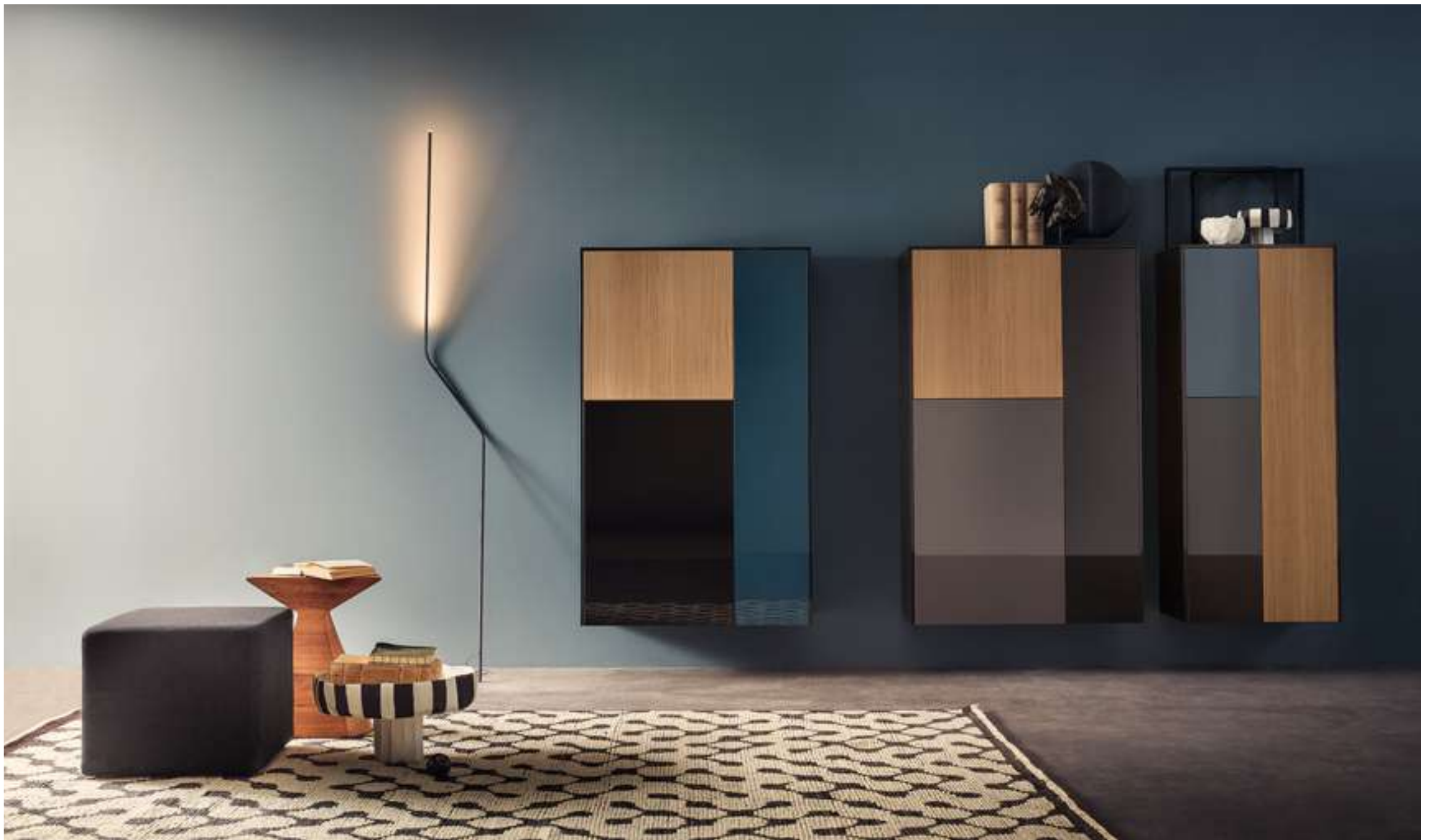
Storage System LT40 Pouf Pouf