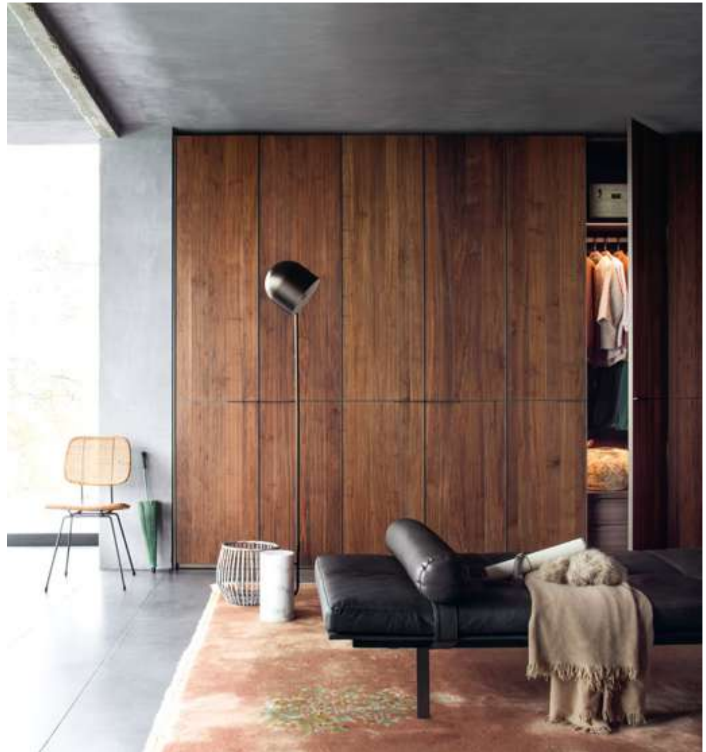
Armadio, Wardrobe Seryasse Daybed Yard