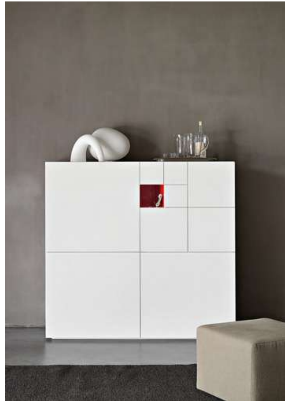
Madia, Sideboard Conchiglia