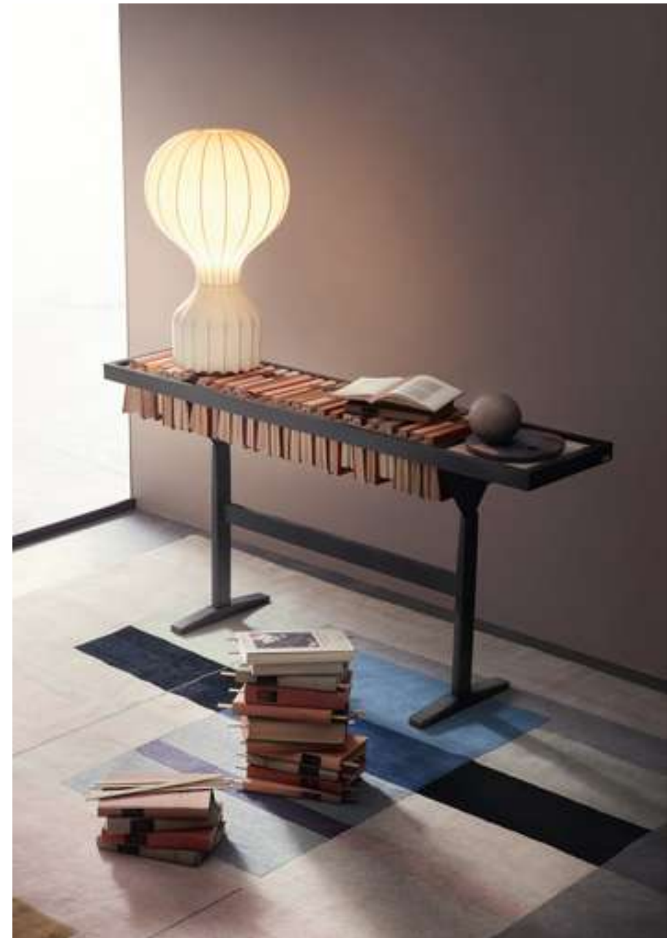
Libreria, Bookcase Booken