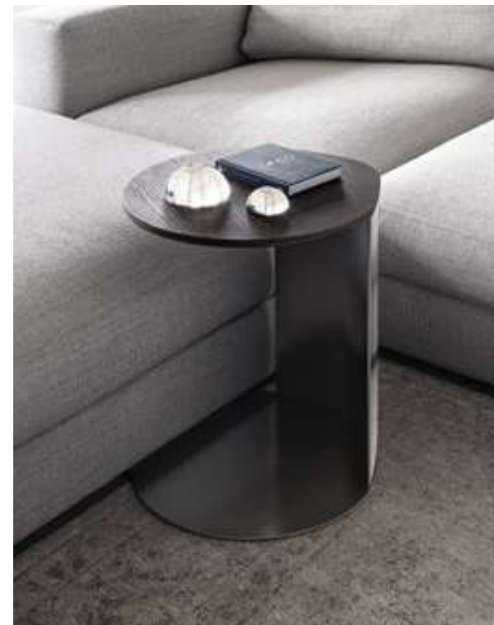
Tavolino, Coffee Table Gullwing Novità, News 2021