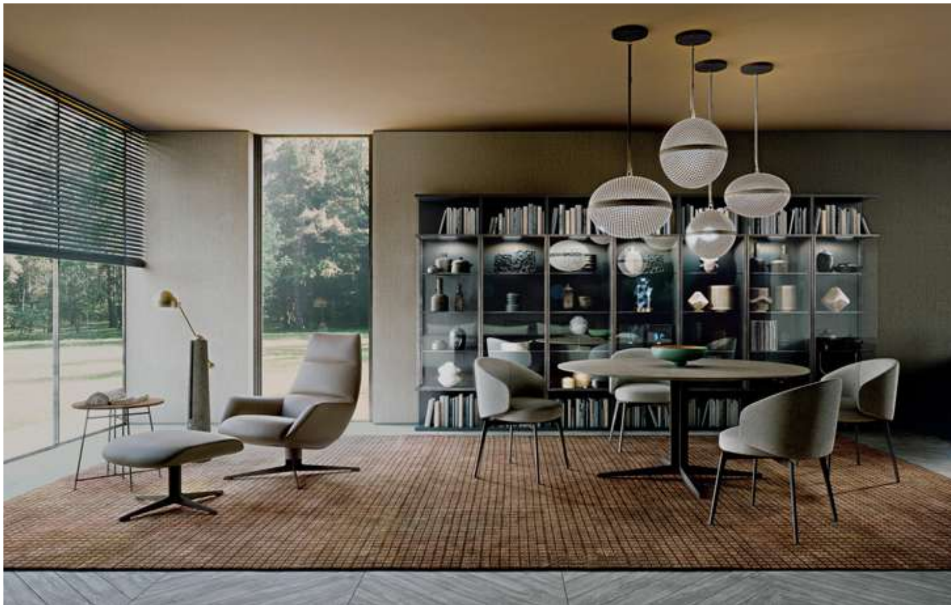
Modular System Selecta Tavolo, Table Graceland Poltroncina, Armchair Bea Bergère Lady Jane Tavolino, Coffee Table Mr. Zheng