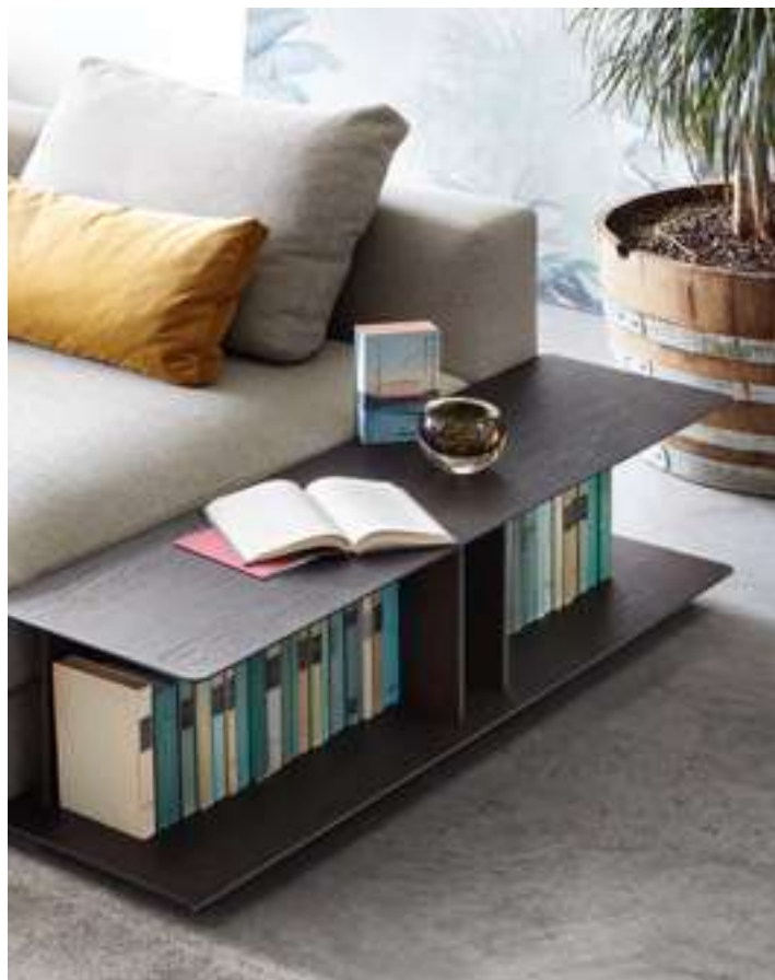
Tavolino, Coffee Table Venice Novità, News 2021