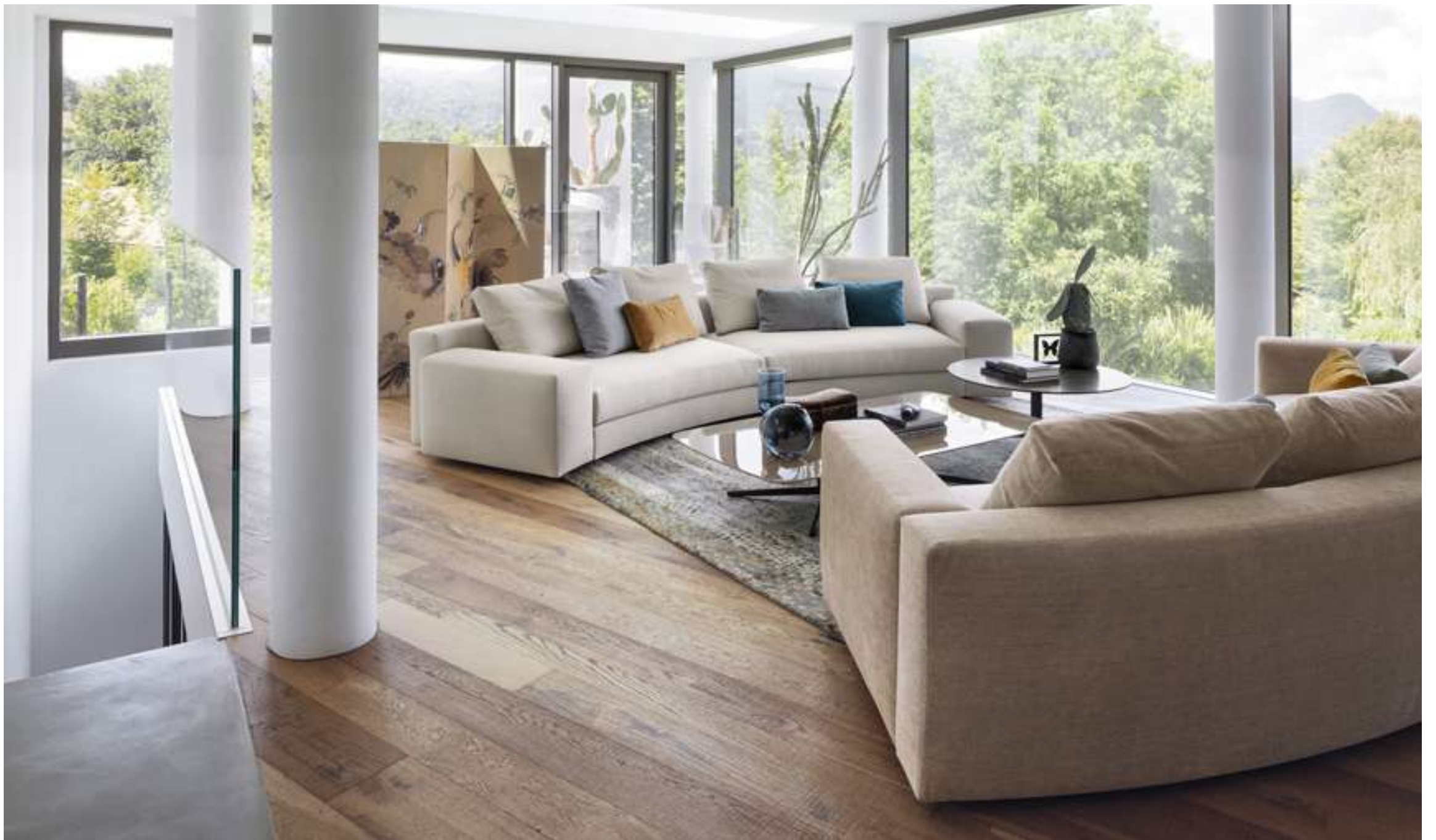
Divano, Sofa Venise Tavolino, Coffee Table Oydo