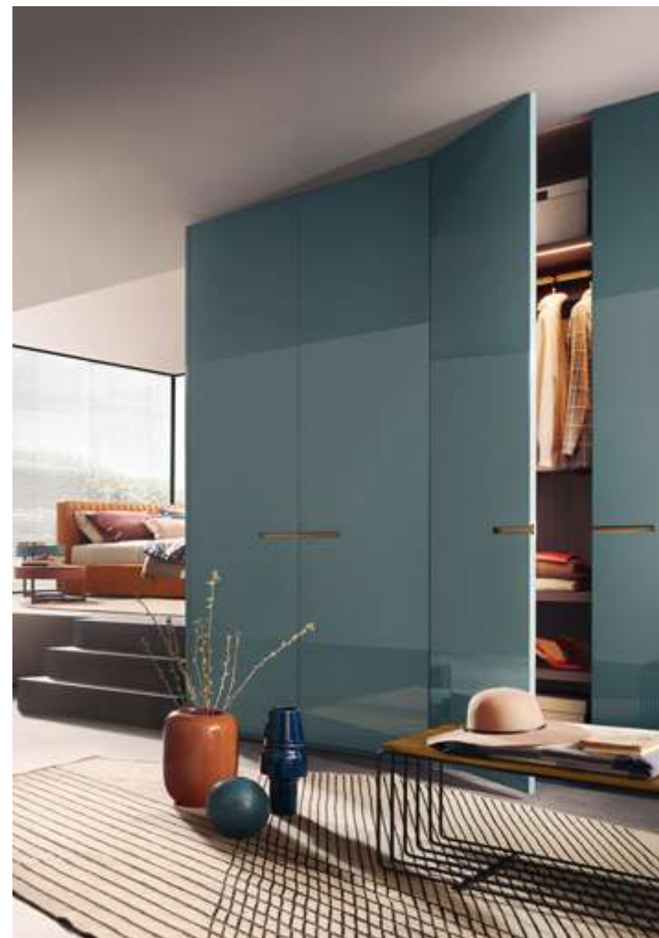
Armadio, Wardrobe Elegant Letto, Bed Picolit