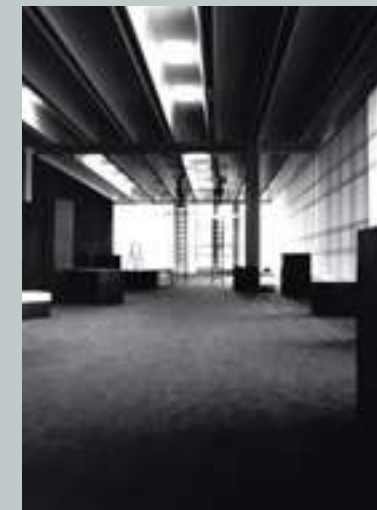
Lema Alzate Brianza headquarters