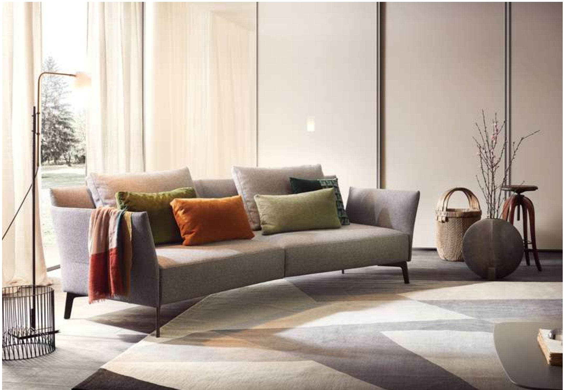
Divano, Sofa Jermyn