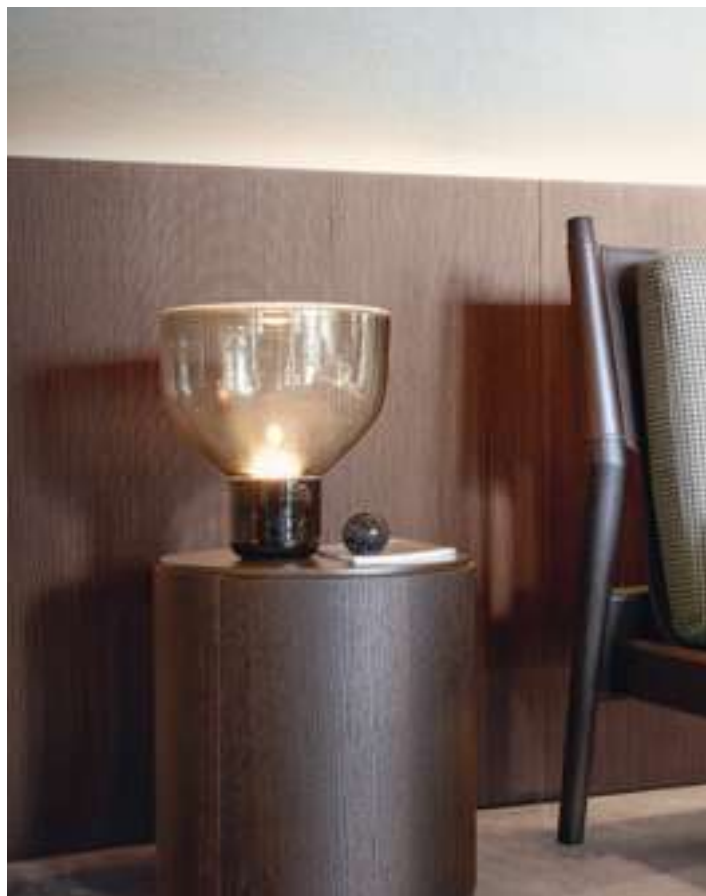
Comodino, Bed Side Table Top