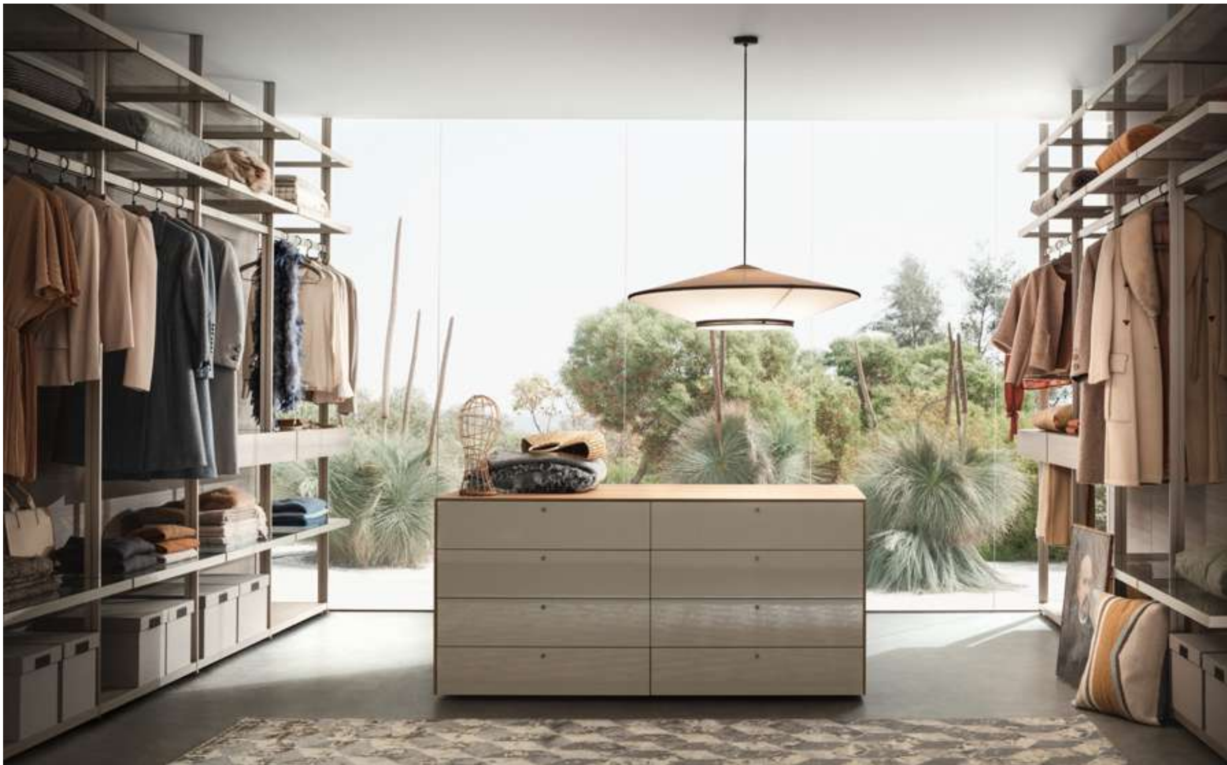
Walk-in Wardrobe Hangar Storage System LT40