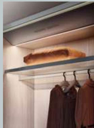
Lema Air Cleaning System