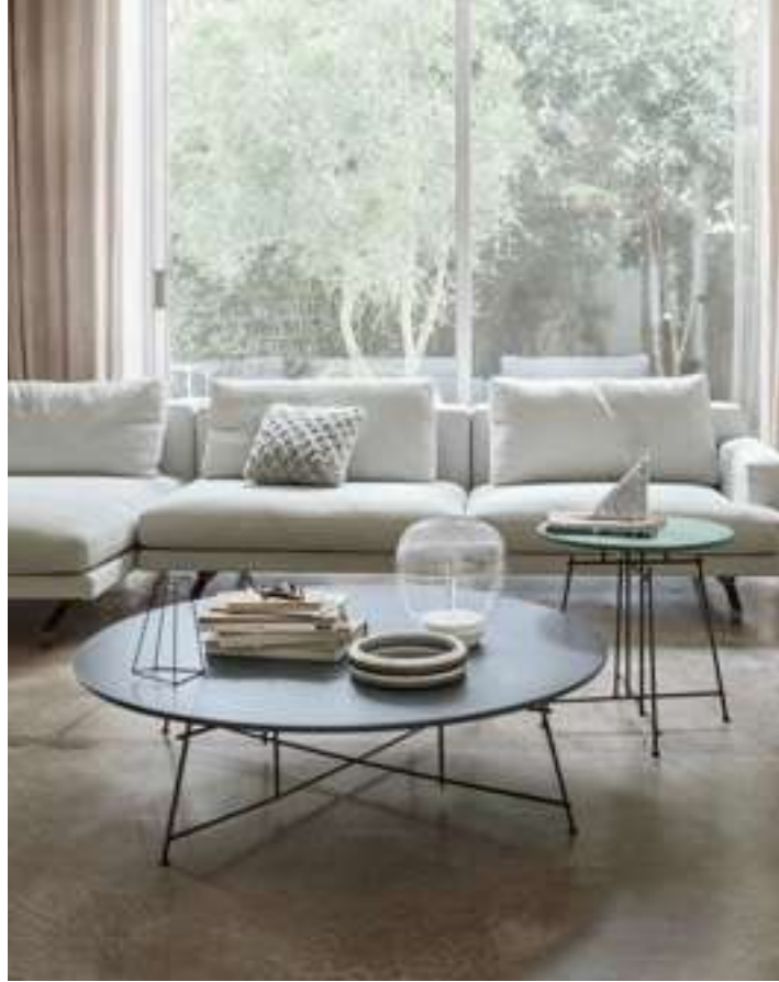
Tavolino, Coffee Table Mr. Zheng