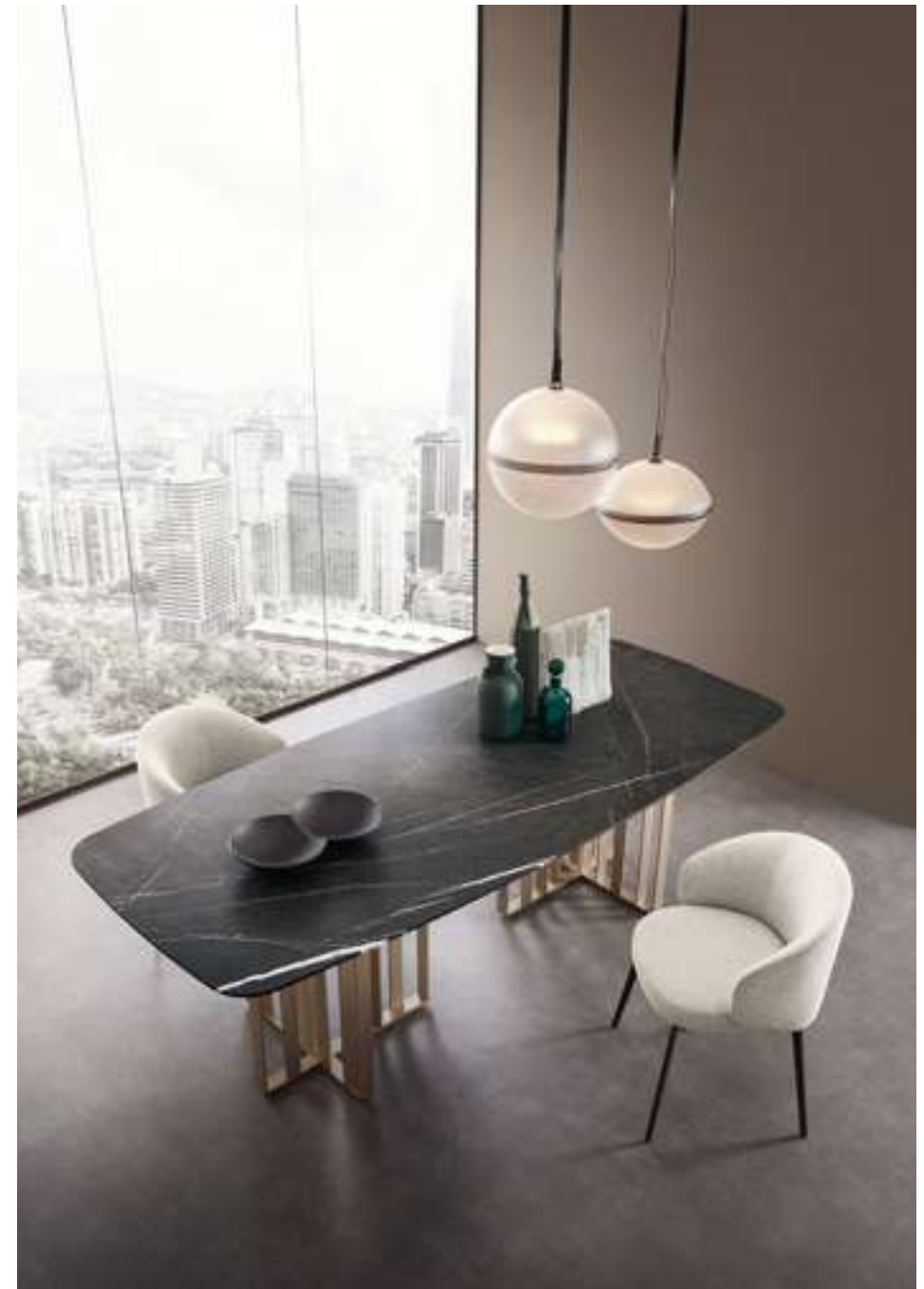
Tavolo, Table Shade Poltroncina, Armchair Bea