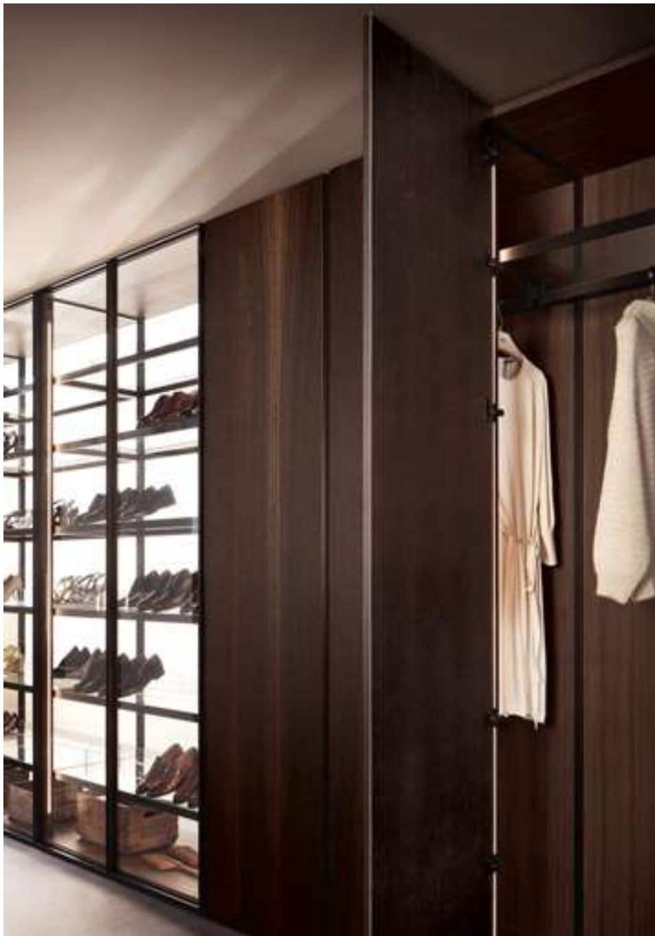
Armadio, Wardrobe Dandy, Text