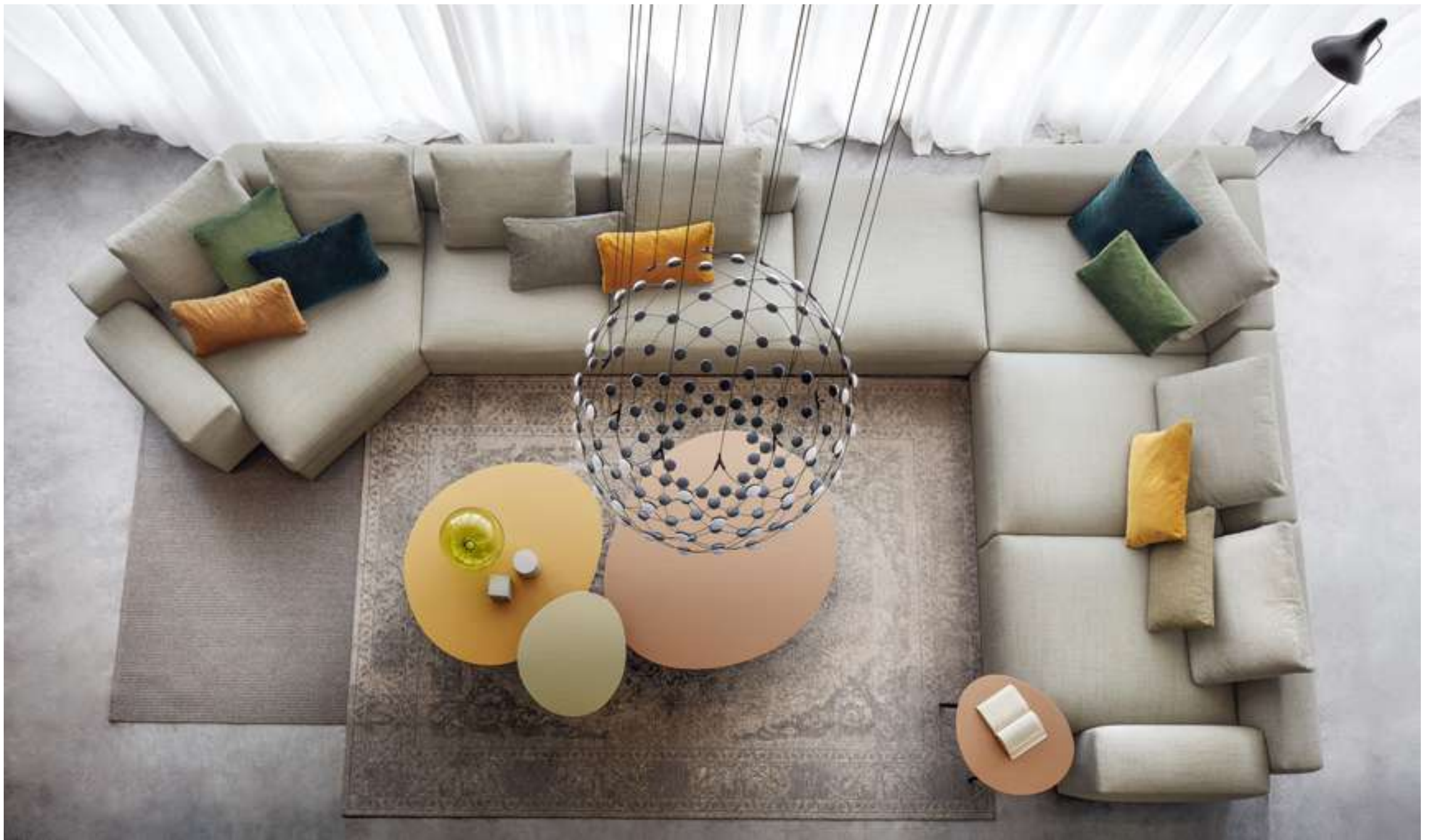
Divano, Sofa Venice Tavolino, Coffee Table Flowers