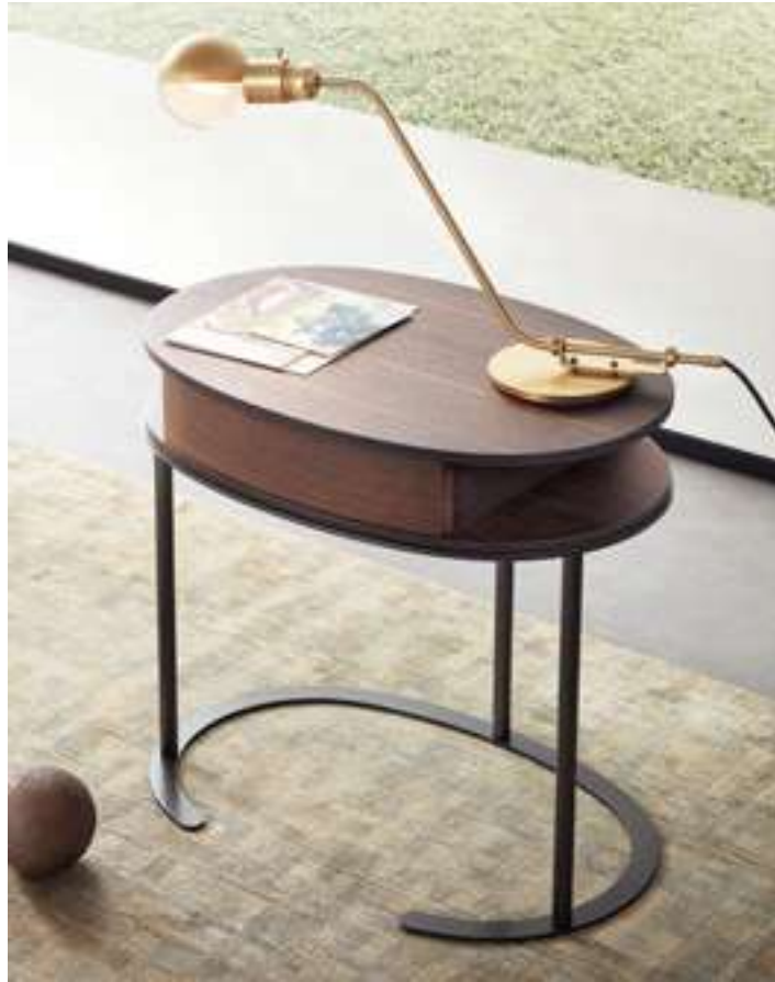
Comodino, Nightstand Ortis Novità, News 2021