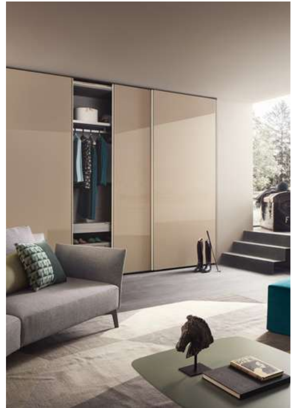
Armadio, Wardrobe Emery Tavolino, Coffee Table Oydo Divano, Sofa Jermyn