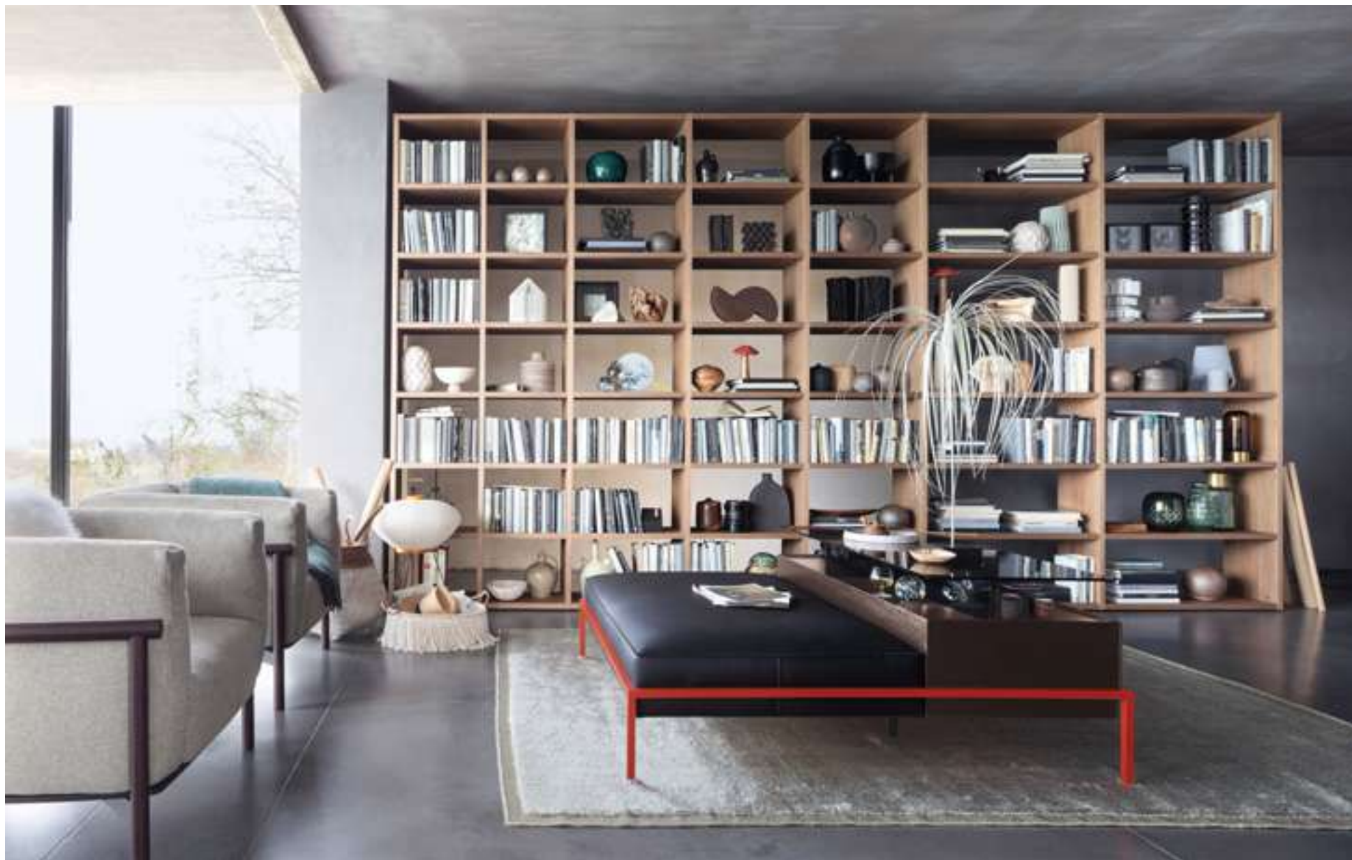
Modular System Selecta Contenitore a Isola, Free-Standing Unit Faro Poltrona, Armchair Taiki