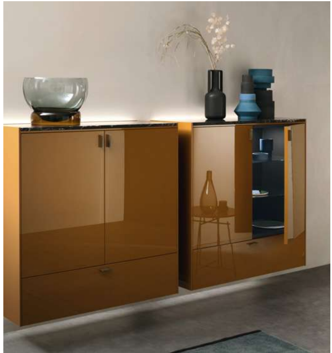
Storage System LT40