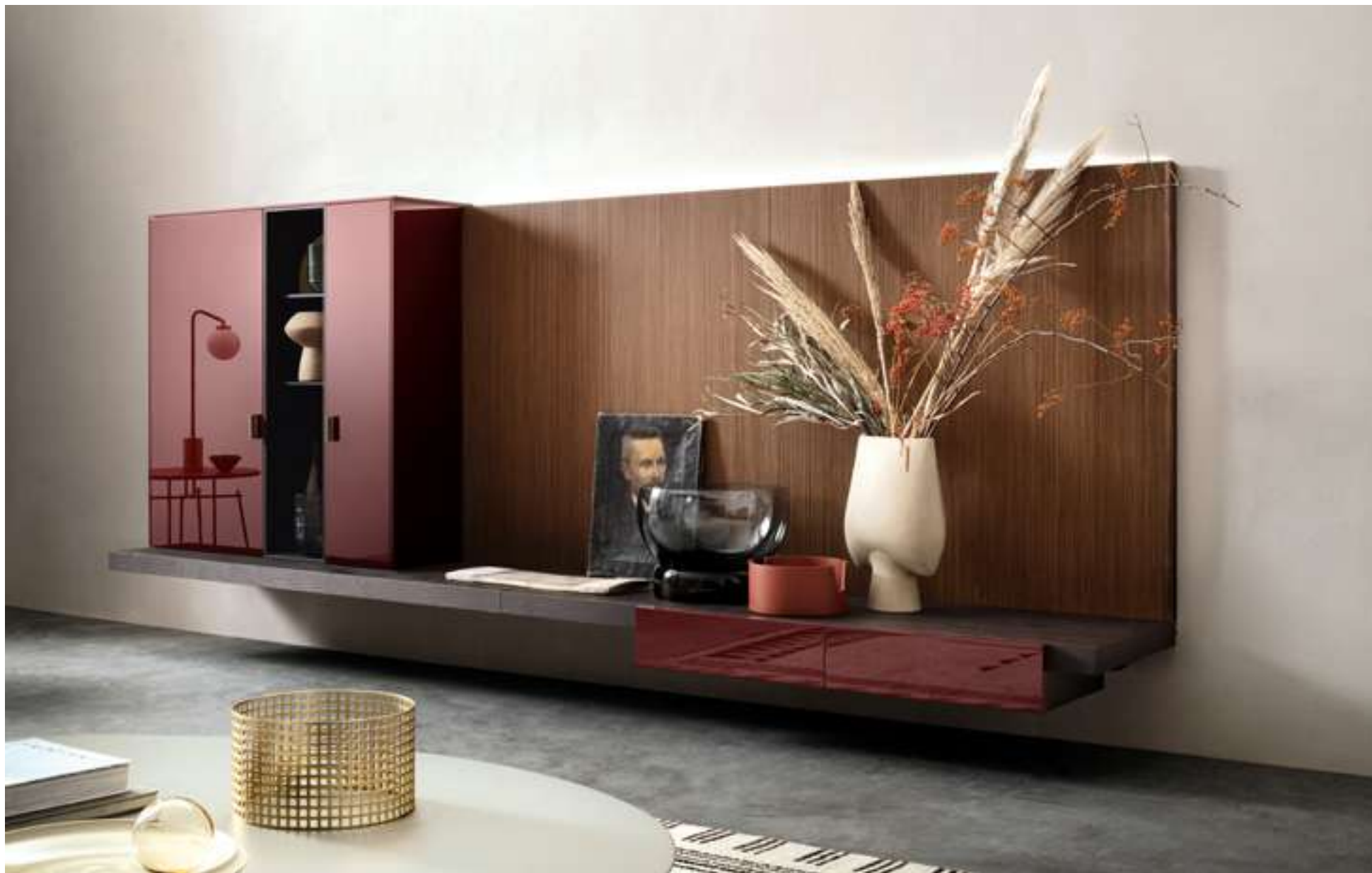
Storage System LT40