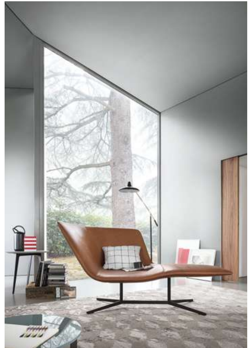
Dormeuse Eydo Tavolino, Coffee Table Flowers