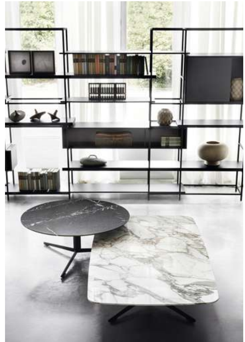
Tavolino, Coffee Table Oydo Libreria, Bookcase Plain