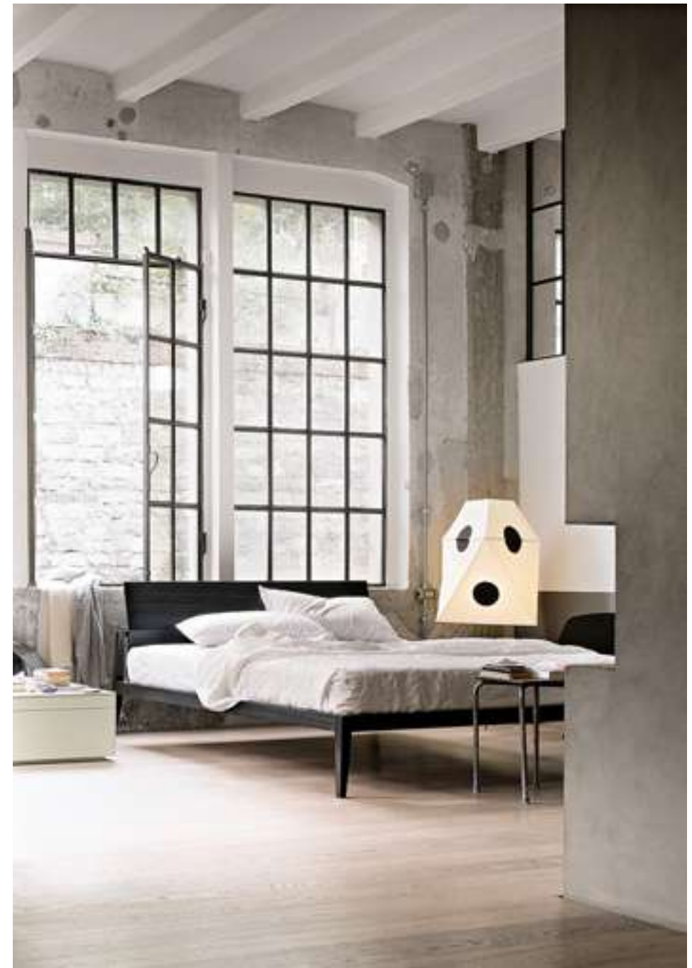
Letto, Bed Theo